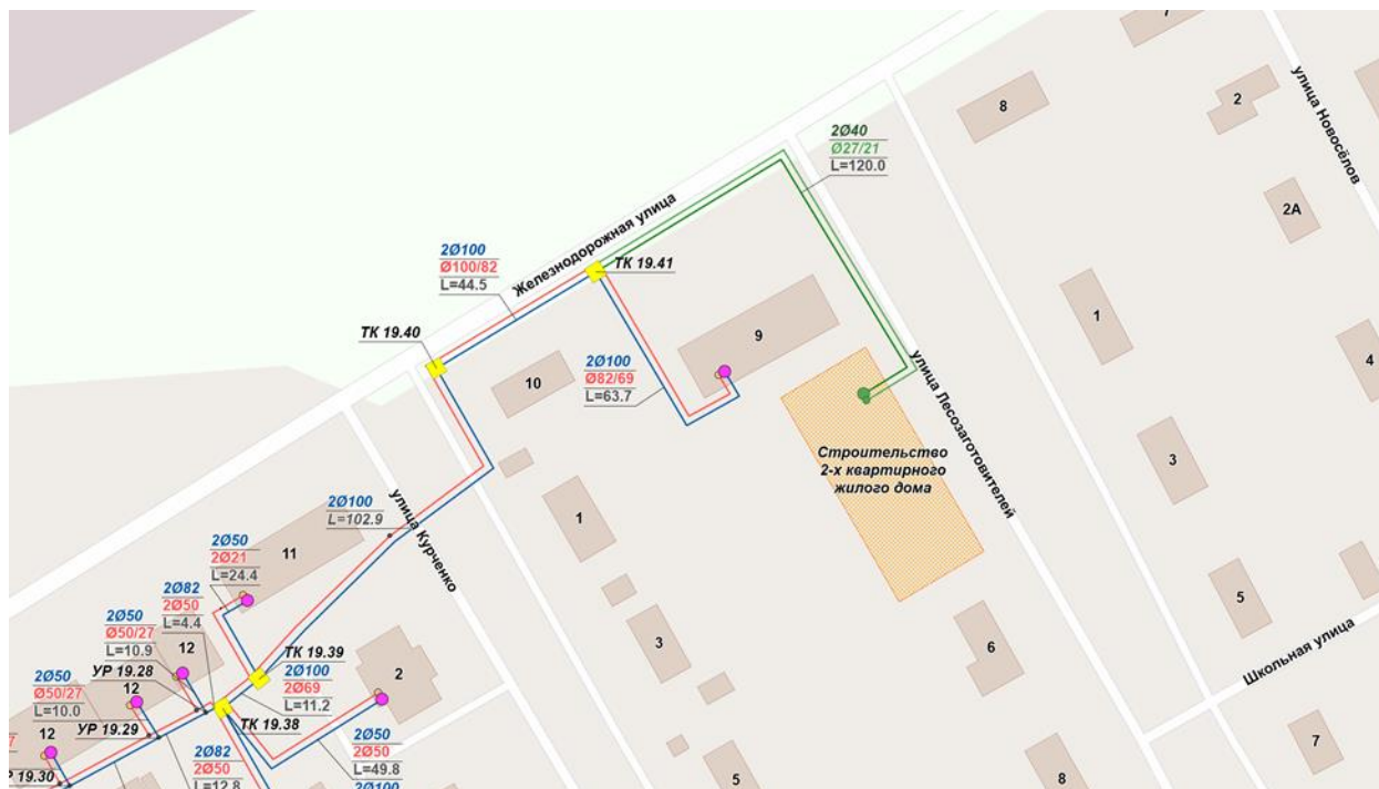
Рисунок 1. Планируемый к подключению 2-х квартирный жилой дом по ул. Лесозаготовителей к централизованной системе теплоснабжения г.п. Таёжный