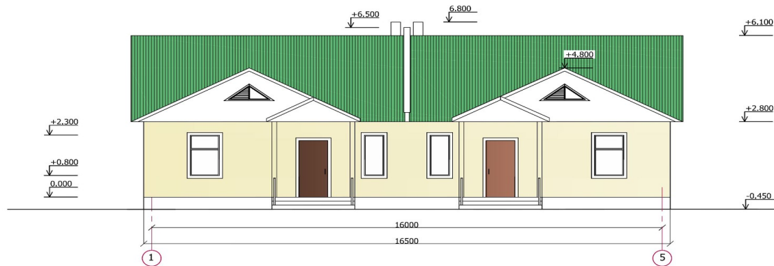
Ф А С А Д В О С Я Х Б - А Ф А С А Д В О С Я Х А - Б (зеркально)