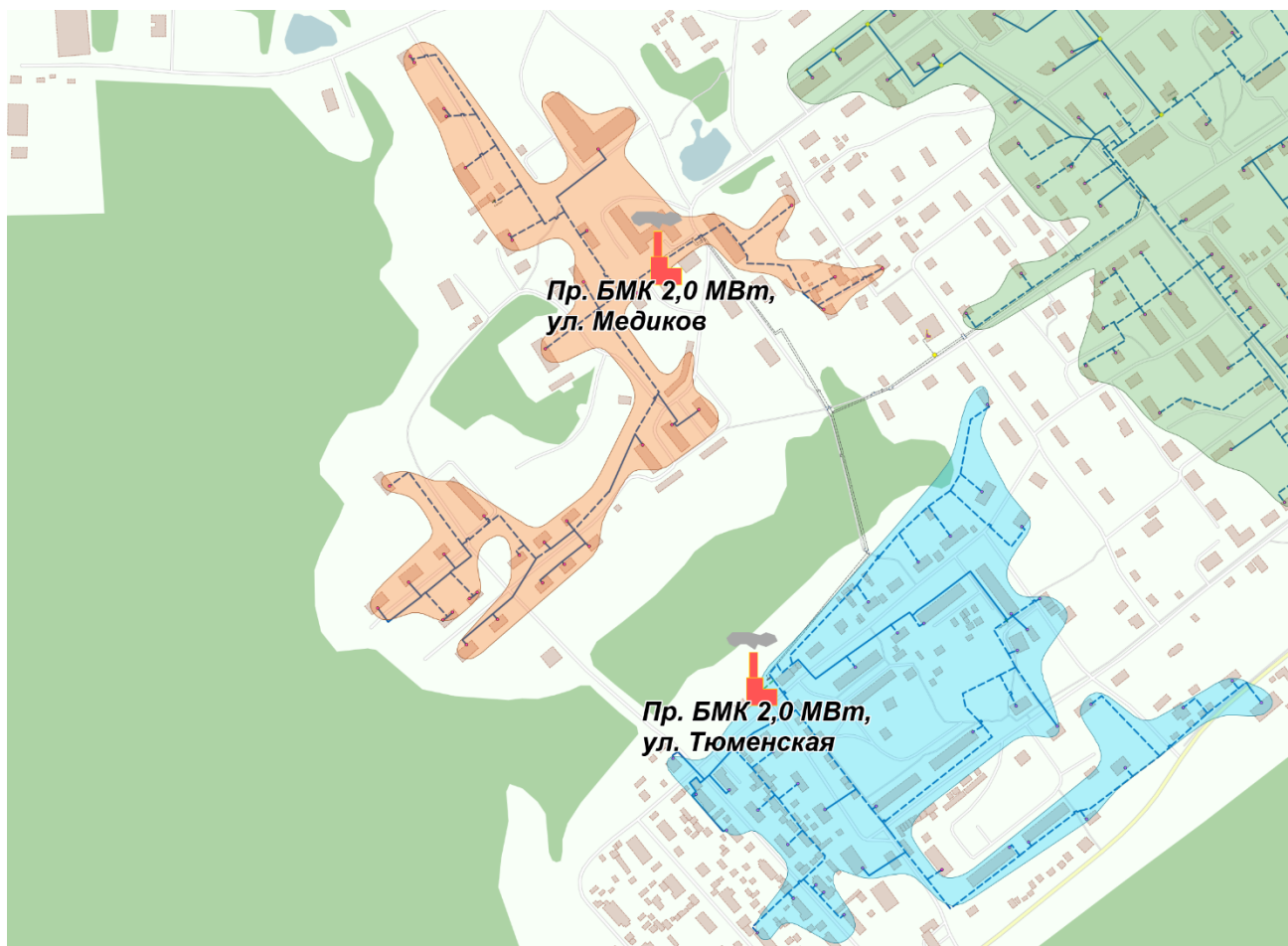
Рисунок 3. Зоны действия и местоположение новых БМК

Также первоочередным мероприятием является замена изношенных тепловых сетей с использованием современных изоляционных материалов для обеспечения нормативной надежности теплоснабжения потребителей.