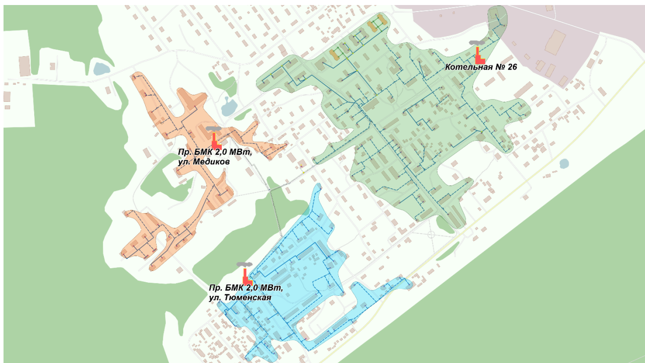
Рисунок 2. Перспективные зоны действия источников тепловой энергии на территории г.п. Коммунистический