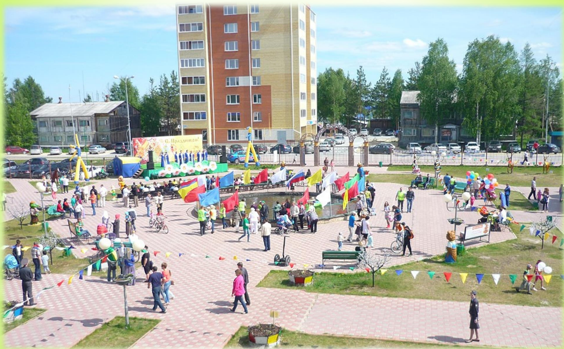
г. Советский 2014 год