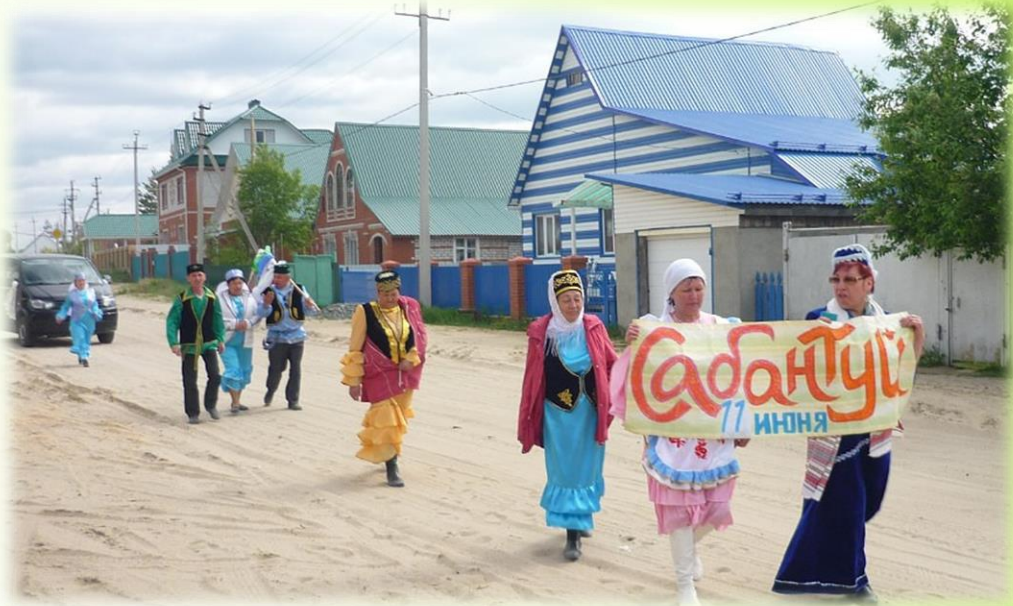
Традиционный сбор подарков 2017 год