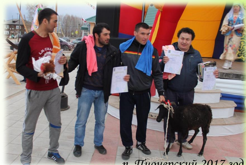
п. Пионерский 2017 год