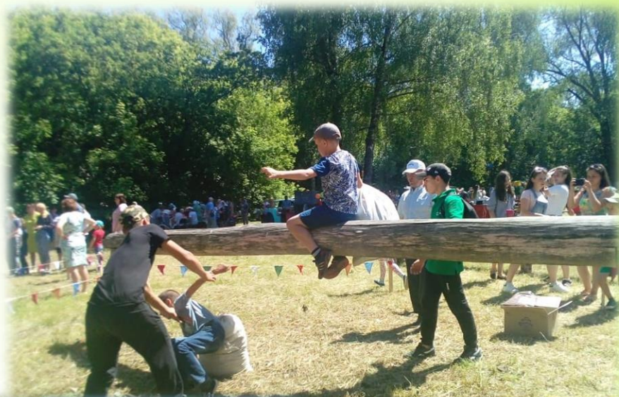
г. Серов 2019 год