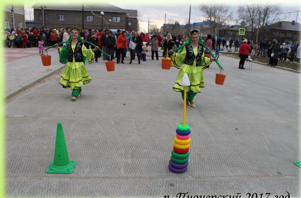
п. Пионерский 2017 год