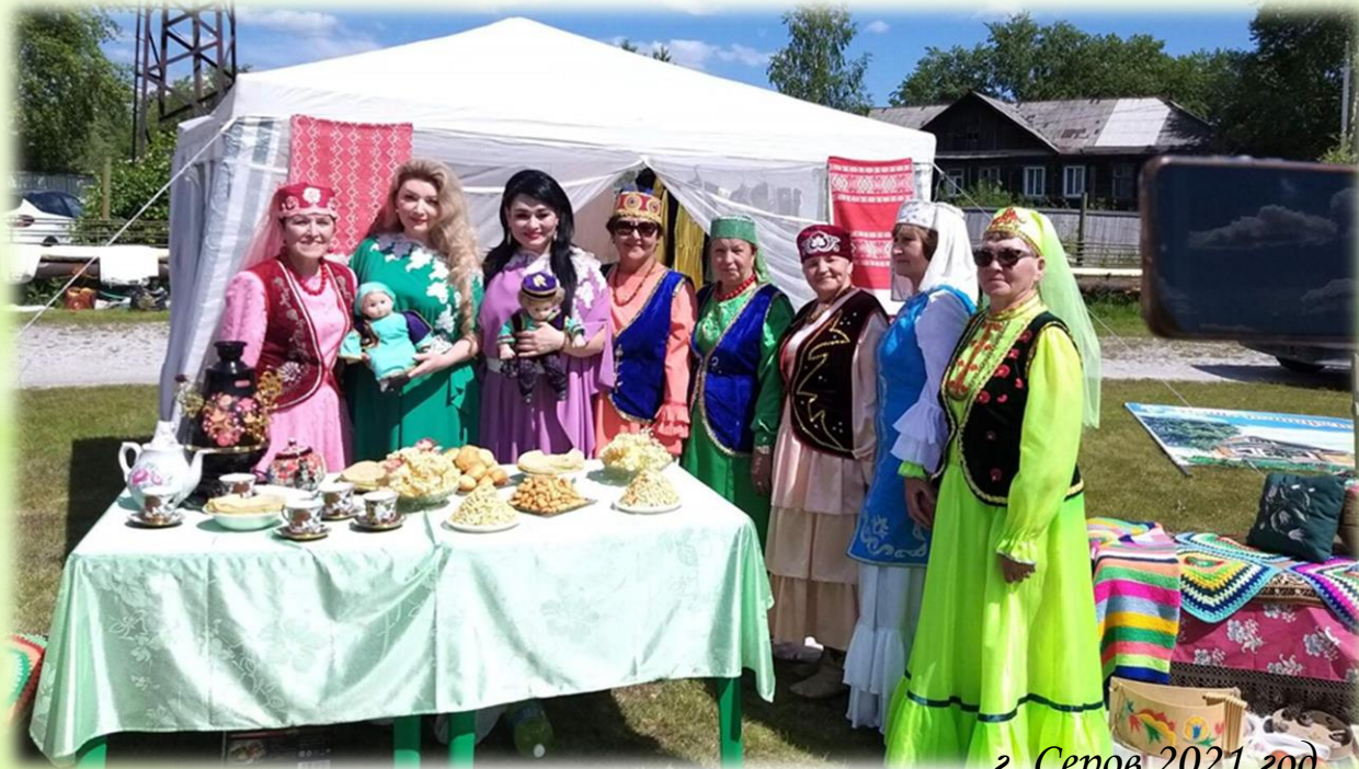
г. Серов 2021 год