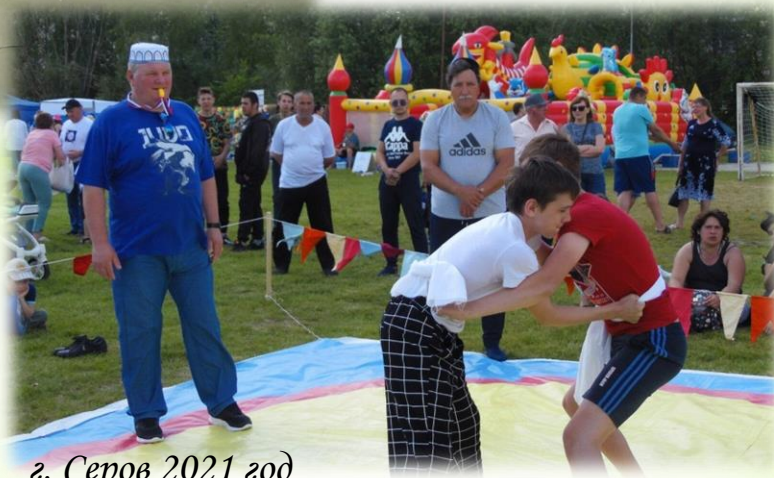
г. Серов 2021 год