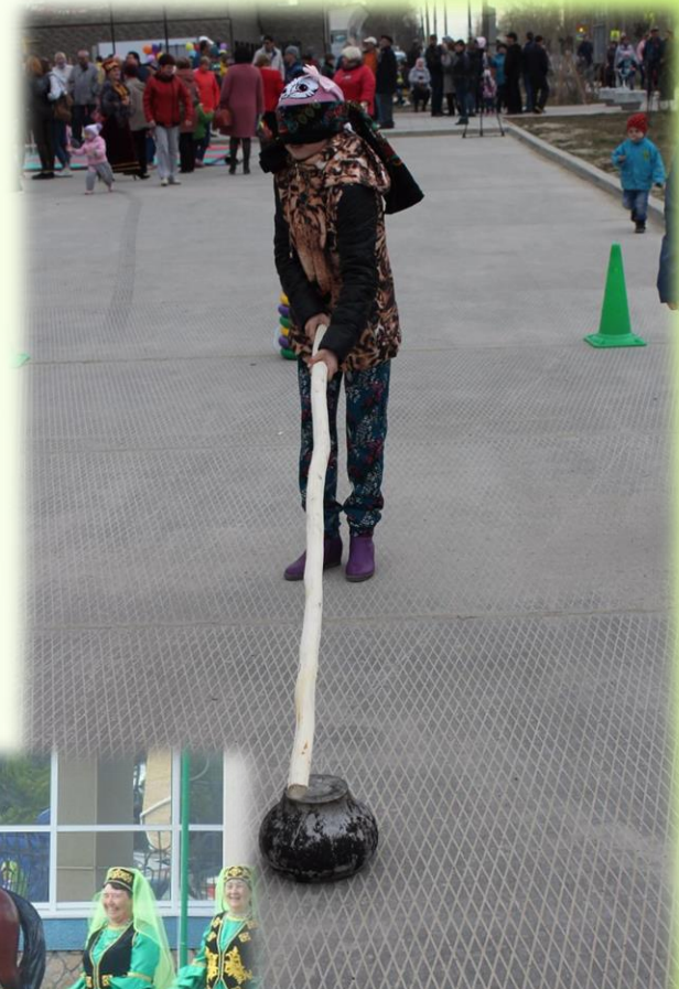
п. Пионерский 2017 год