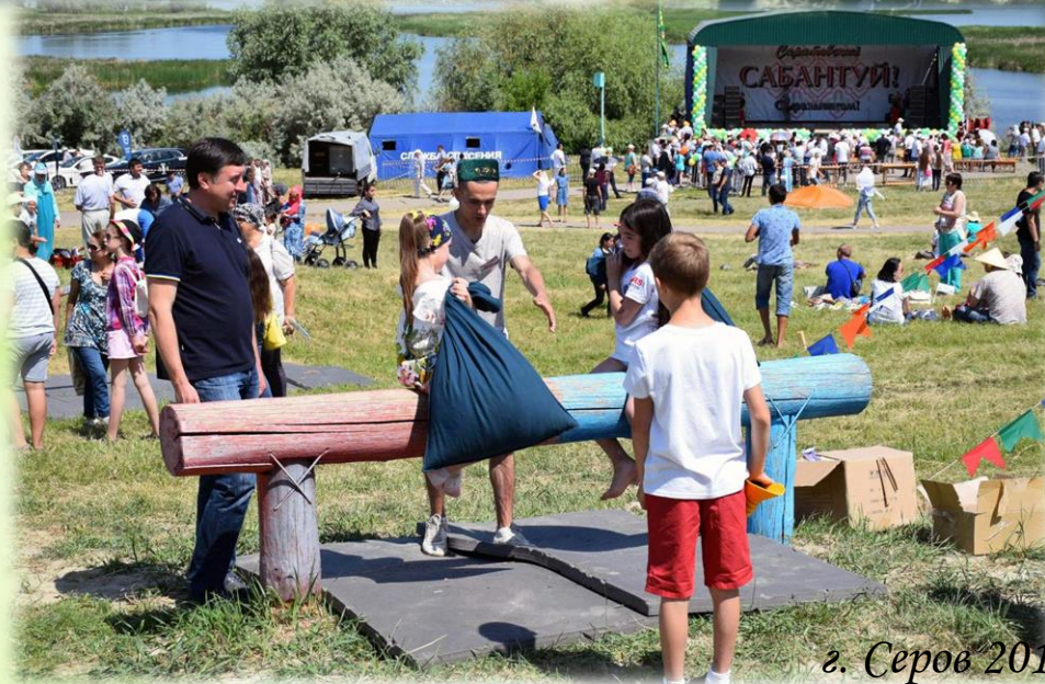
г. Серов 2019 год