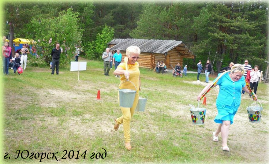
г. Югорск 2014 год