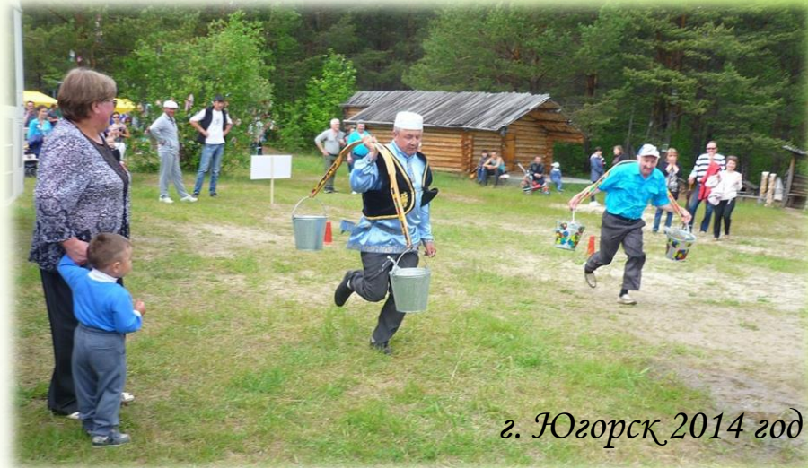
г. Югорск 2014 год