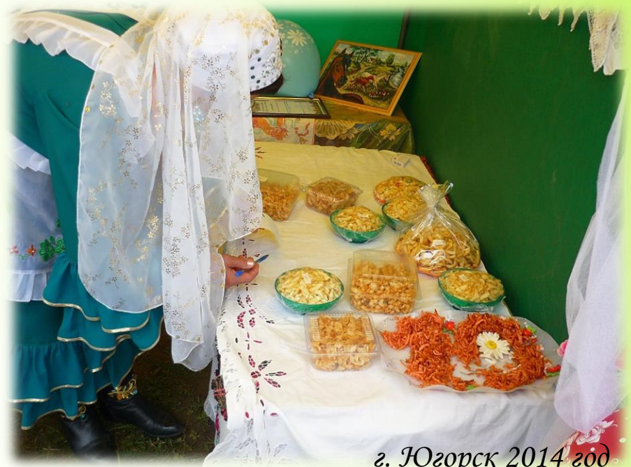
г. Югорск 2014 год