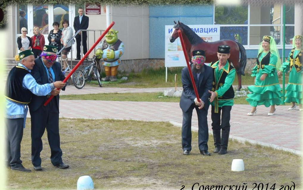
г. Советский 2014 год