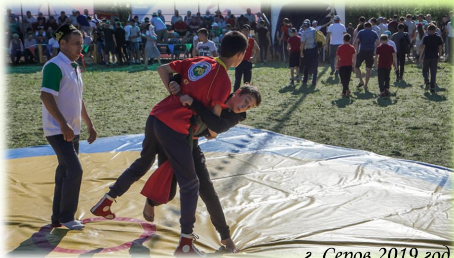
г. Серов 2019 год