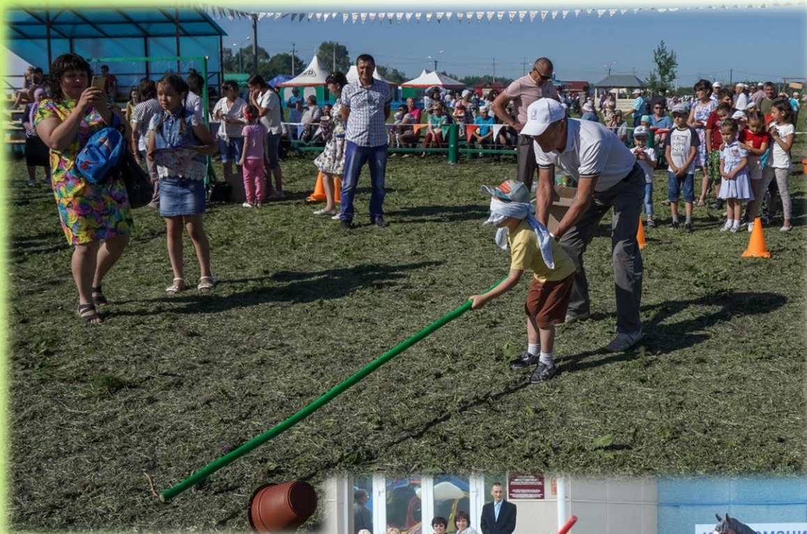
г. Серов 2019 год

с завязанными глазами при помощи палки необходимо разбить глиняные горшки стоящие на земле