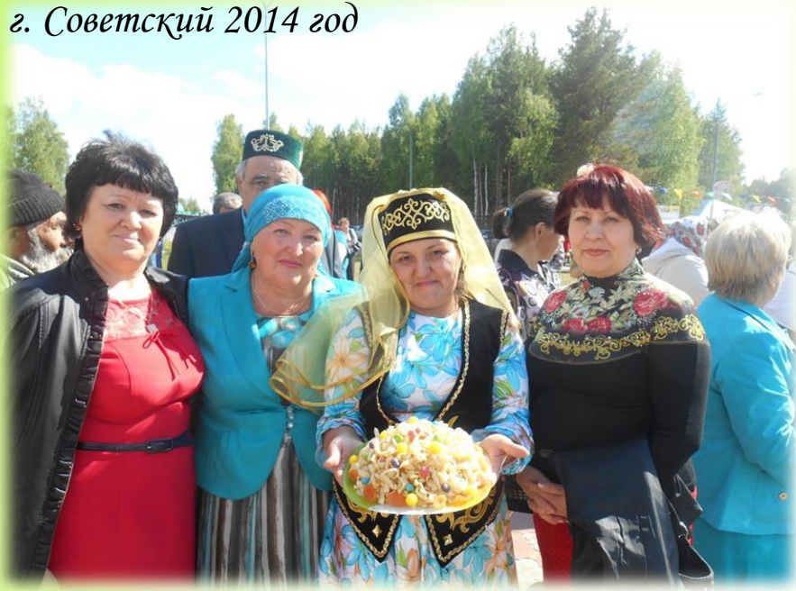
г. Советский 2014 год