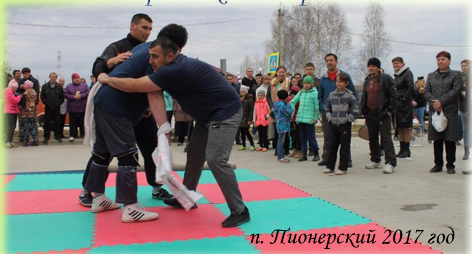
п. Пионерский 2017 год

Цель соревнования - захватить противника за пояс и завалить его на землю. Сначала борьба проводится между мальчиками, потом в бой вступают юноши, третьи пары - мужчины средних лет. Кульминация состязания - борьба между двумя непобежденными джигитами. Победитель куреша (батыр) получает главный приз – живого барана.