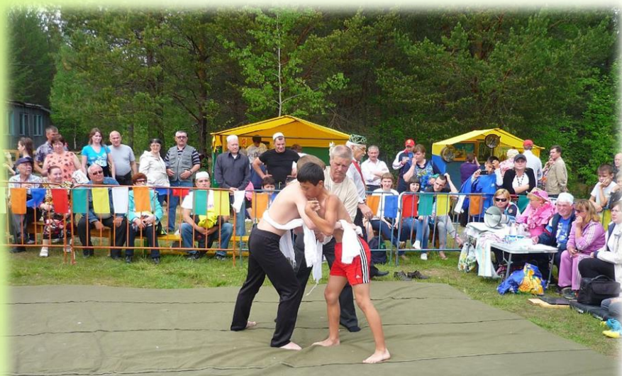
г. Югорск 2014 год

На Сабантуе принято проводить различные состязания и игры для демонстрации силы, ловкости и просто для развлечения народа. Самая любимая забава всех джигитов - куреш, борьба на поясах, которая проводится между мужчинами разных возрастов.