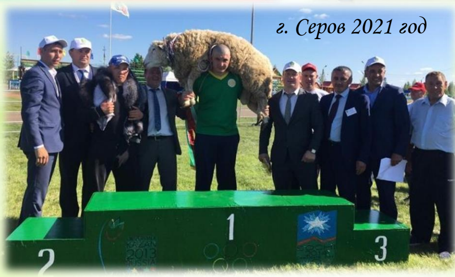
г. Серов 2021 год