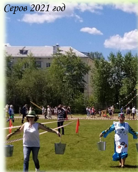
г. Серов 2021 год