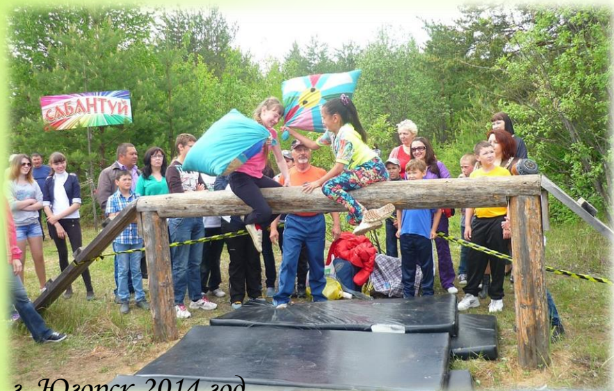
г. Югорск 2014 год

бой мешками с травой или сеном, который проходит на скользком, неустойчивом бревне