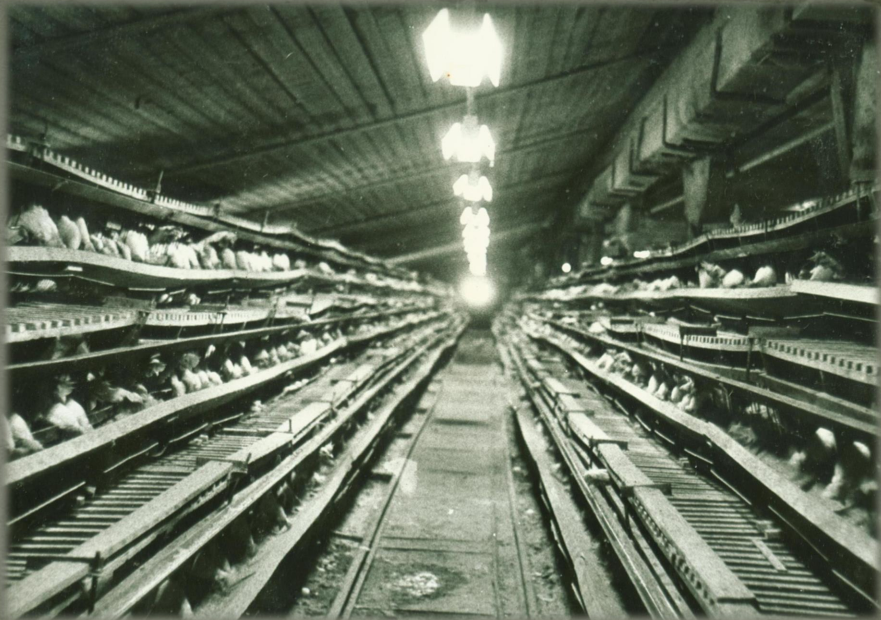
Птичник подсобного хозяйства Малиновского леспромхоза. Фонд Фотодокументов. Опись 2. Дело 6. Лист 16.