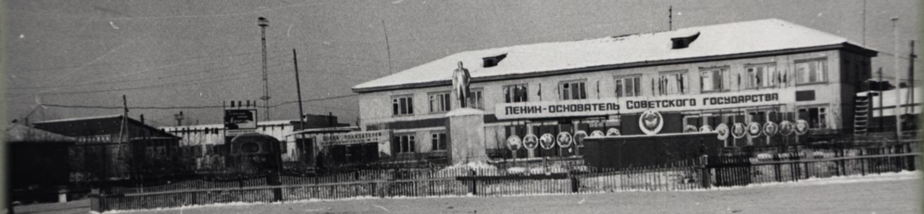
Административное здание Малиновского леспромхоза. п. Малиновский. 1977 год. Фонд Фотодокументов. Опись 1. Дело 91.