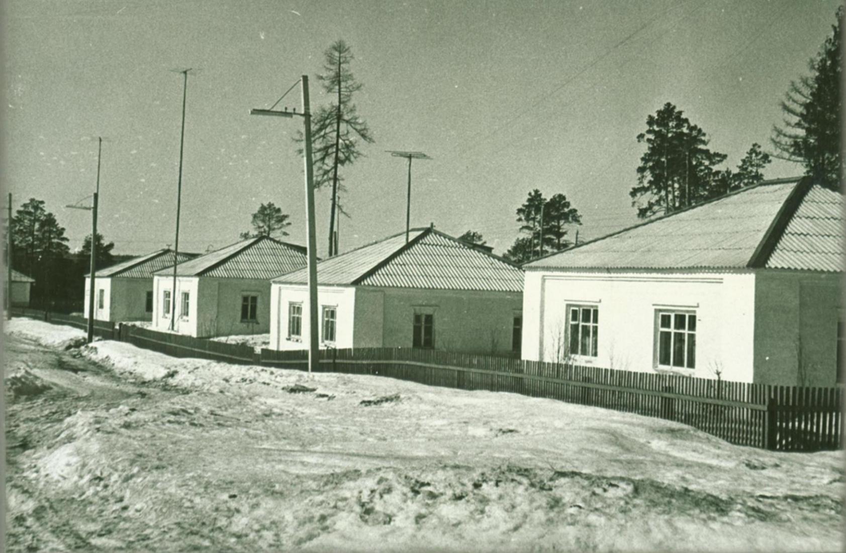
Улица Гагарина. Фонд Фото документов. Опись 2. Дело 6. Лист 5.