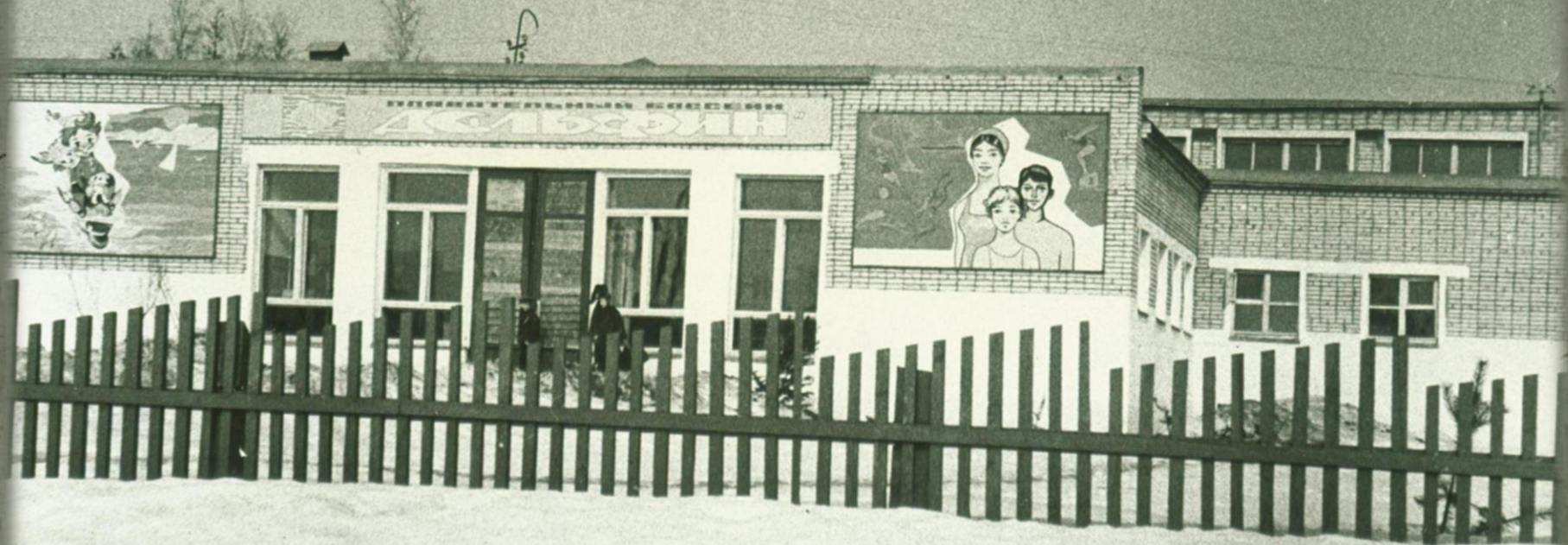
Внешний вид плавательного бассейна «Дельфин». Фонд Фотодокументов. Опись 2. Дело 6. Лист 20.