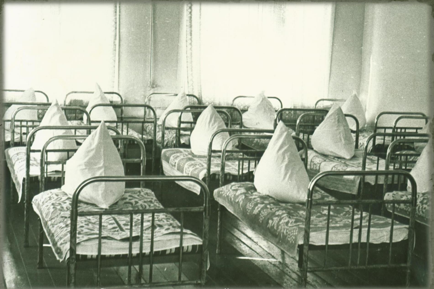
Спальная комната старшей группы детского сада. Фонд Фотодокументов. Опись 2. Дело 6. Лист 19.