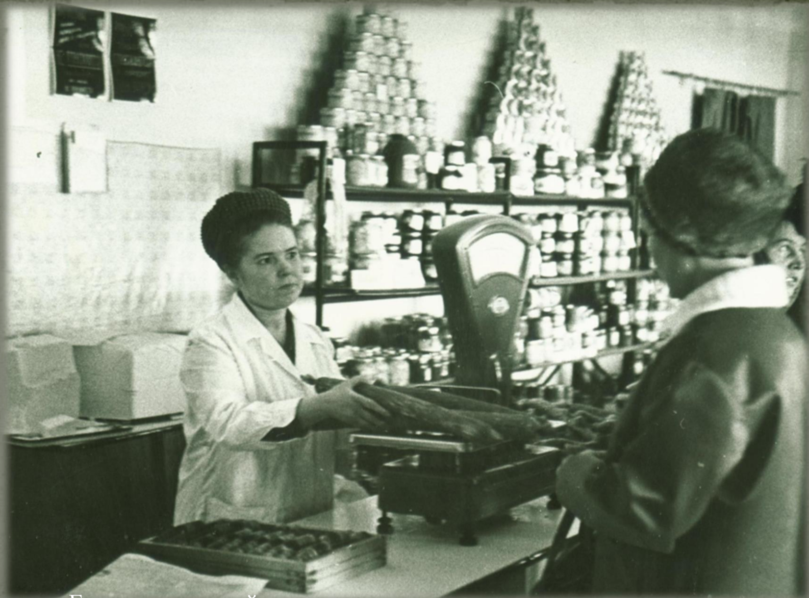
Гастрономический отдел магазина продовольственных товаров. Фонд Фотодокументов. Опись 2. Дело 6. Лист 11.