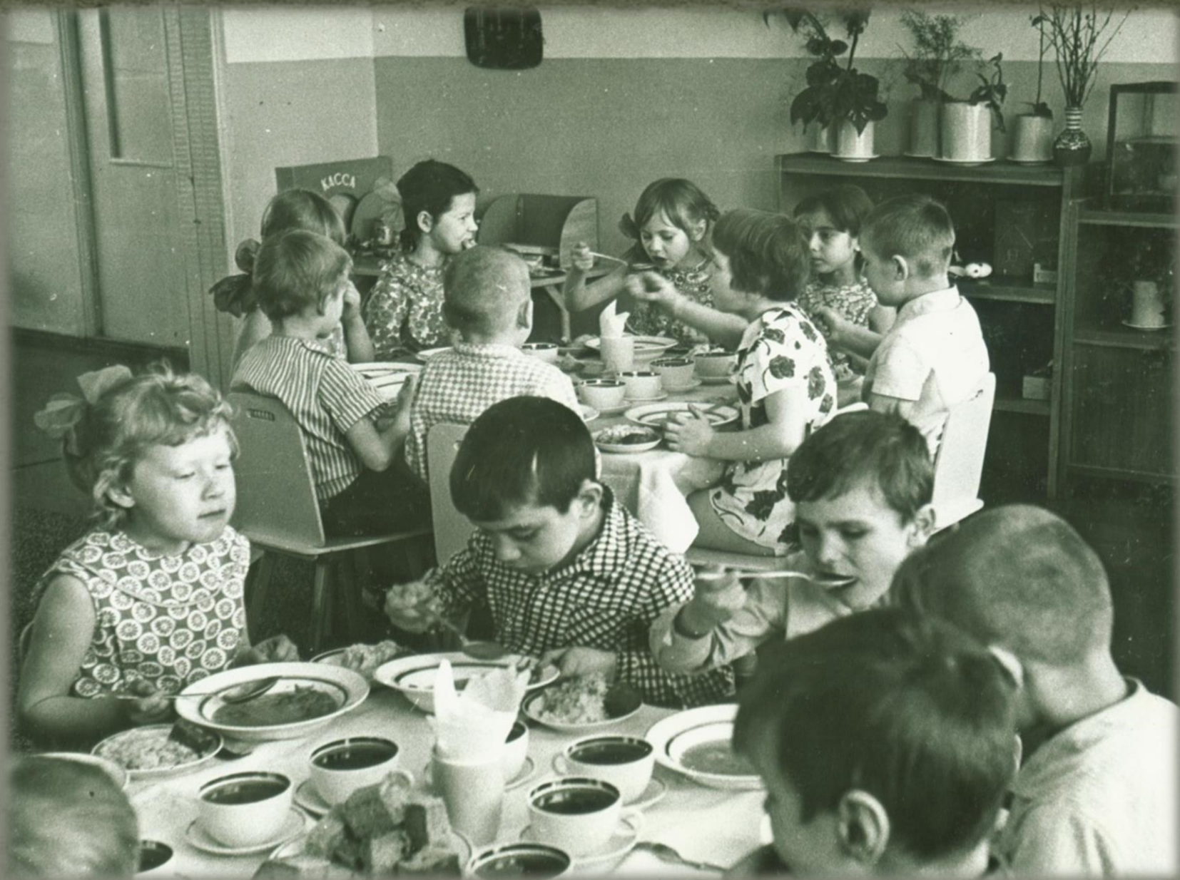
Обед в одной из двенадцати групп детского сада.