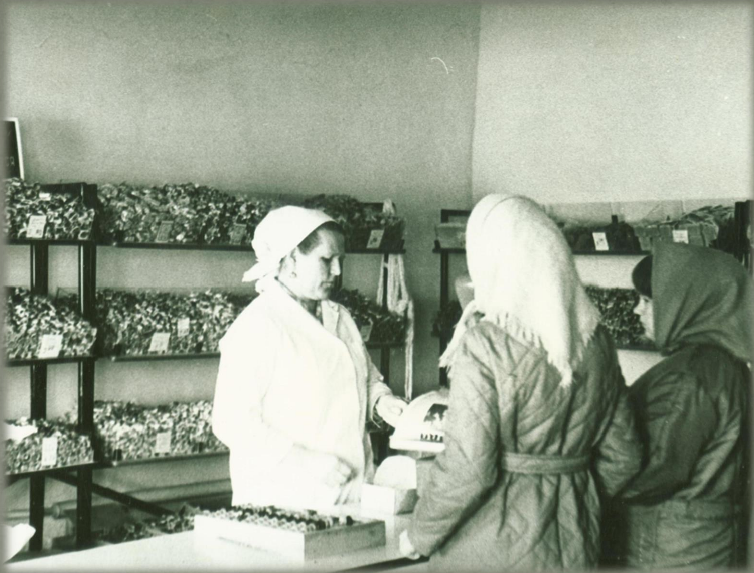
Кондитерский отдел магазина продовольственных товаров. Фонд Фото документов. Опись 2. Дело 6. Лист 12.