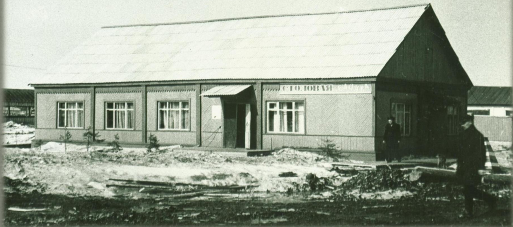
Стационарная столовая «Елочка» на нижнем складе – 32 посадочных места. Фонд Фото документов. Опись 2. Дело 6. Лист 9.