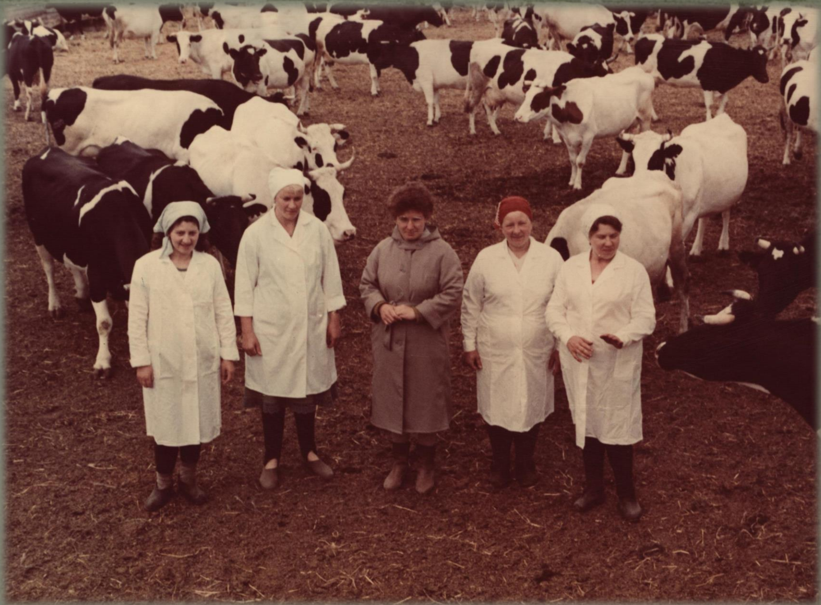
Доярки молочно-товарной фермы Малиновского леспромхоза, достигшие трехтысячного рубежа по надоям молока в районе.