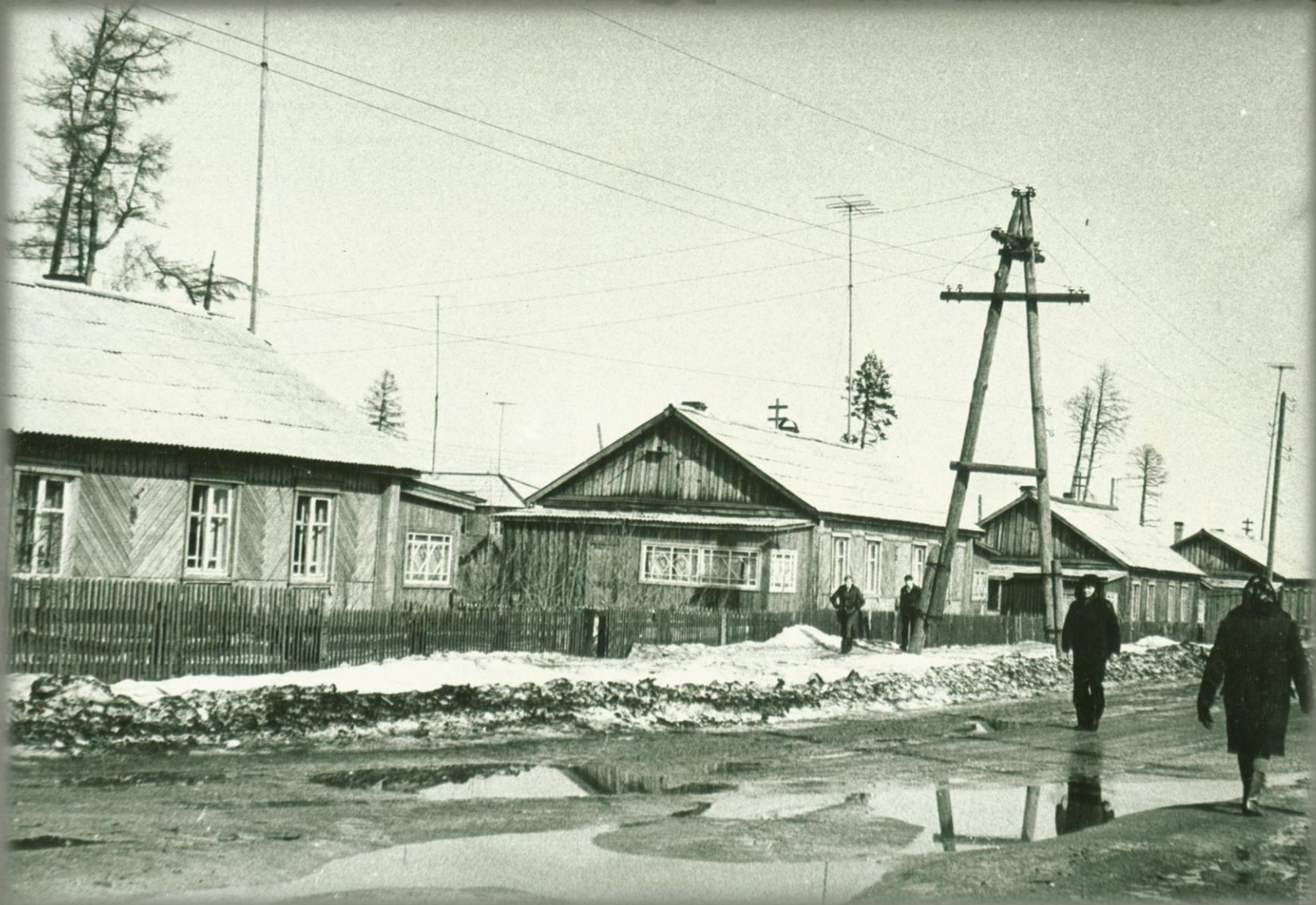
Улица Кузнецова. Фонд Фотодокументов. Опись 2. Дело 6. Лист 4.