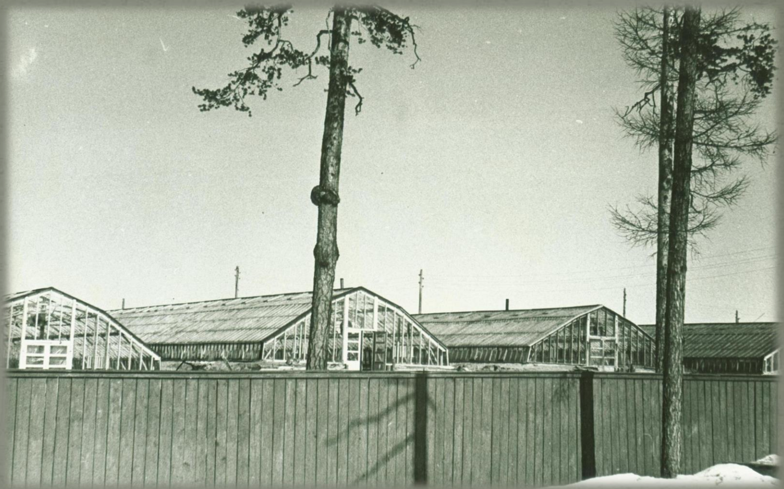
Общий вид тепличного хозяйства Малиновского леспромхоза. Фонд Фотодокументов. Опись 2. Дело 6. Лист 4.

В 1971 году в структуре леспромхоза образуется подсобное хозяйство, которое занимается птицеводством, выращиванием овощей в тепличном хозяйстве, скотоводством.