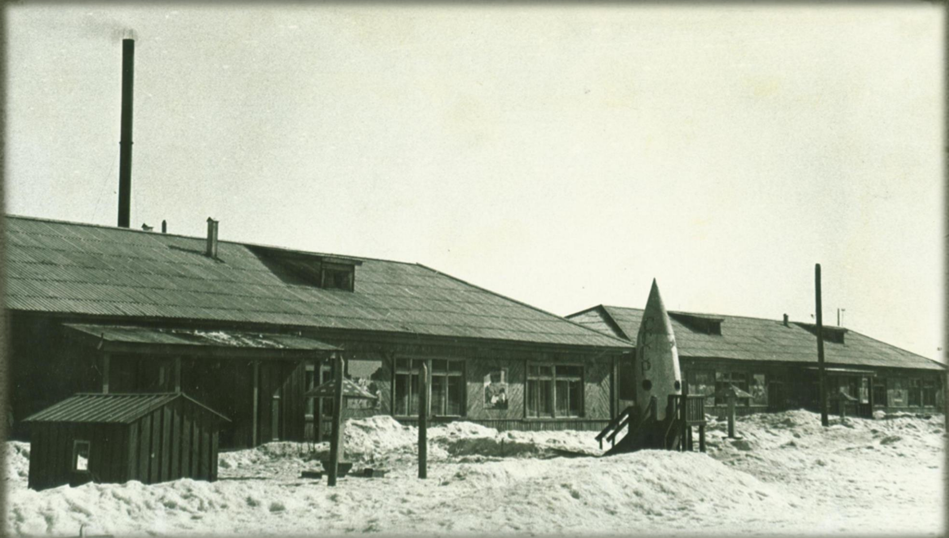
Детский сад-ясли. Фонд Фотодокументов. Опись 2. Дело 6. Лист 17.