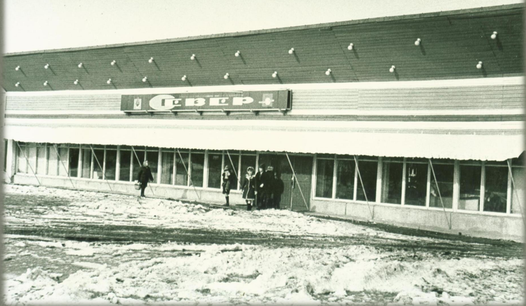
Магазин промышленных товаров «Север» на 5 рабочих мест.