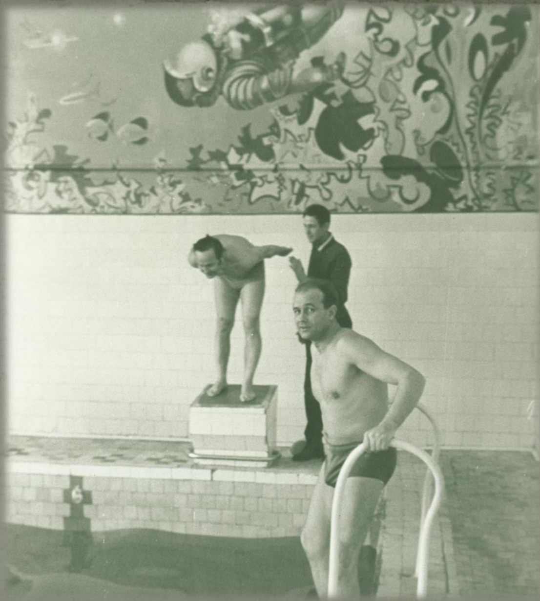
Занятия в бассейне «Дельфин».