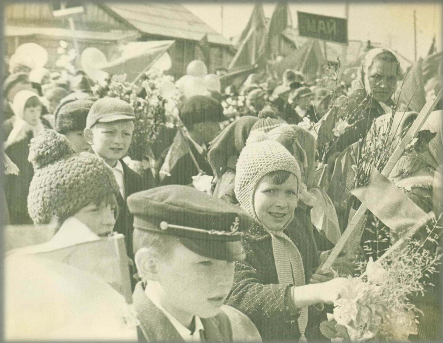
Школьники на первомайской демонстрации. Фонд Фотодокументов. Опись 2. Дело 6. Лист 4.