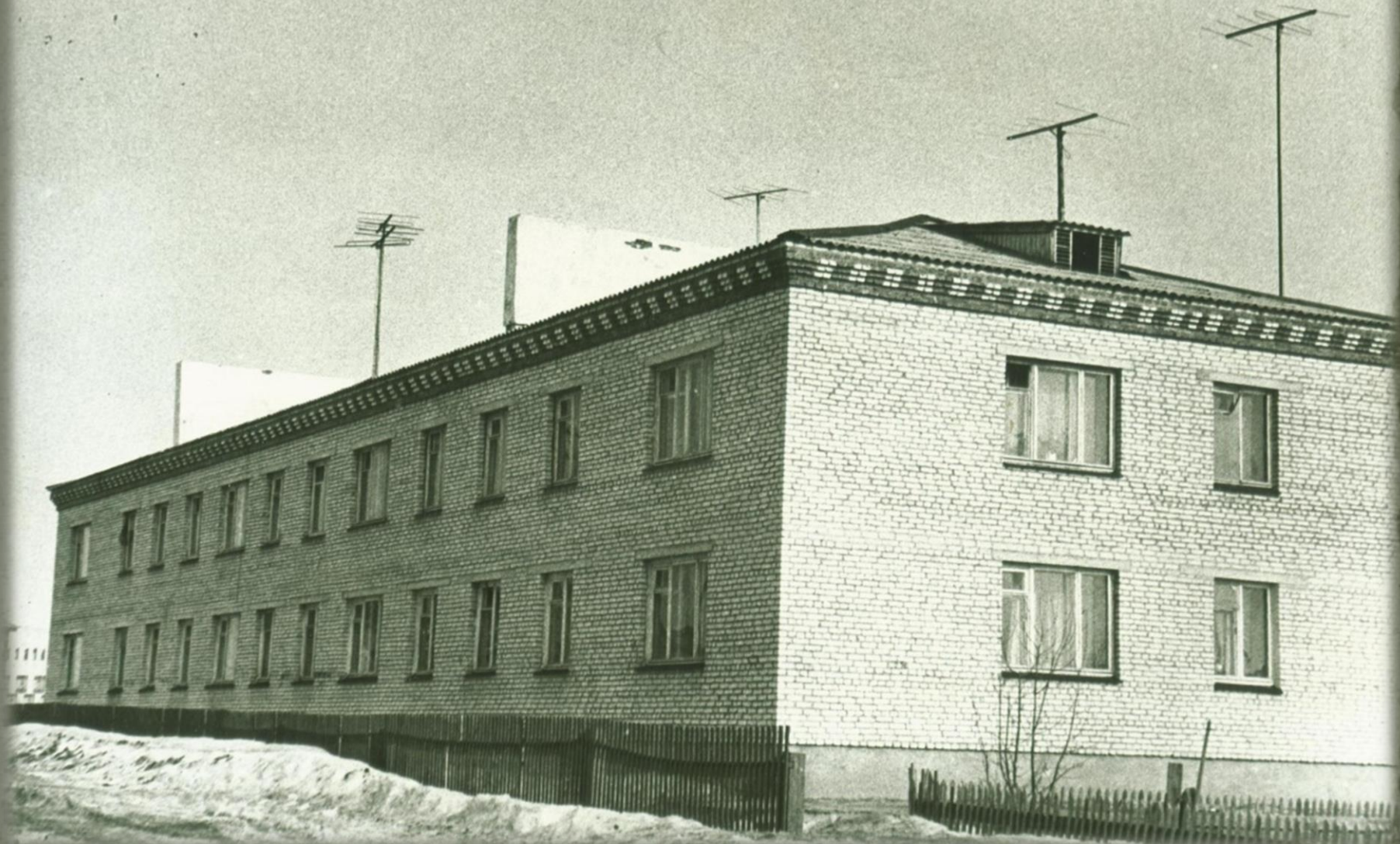
Шестнадцати квартирный жилой дом со всеми удобствами. Фонд Фотодокументов. Опись 2. Дело 6. Лист 6.