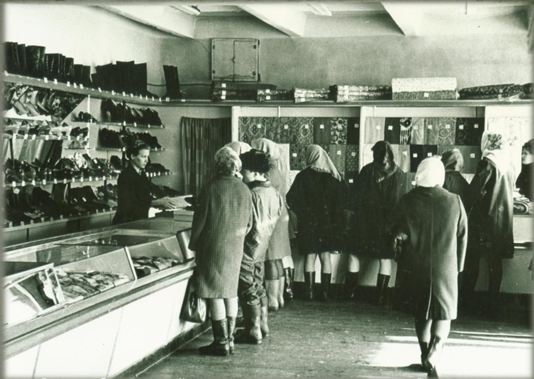
Отделы обуви и тканей магазина промышленных товаров «Север».