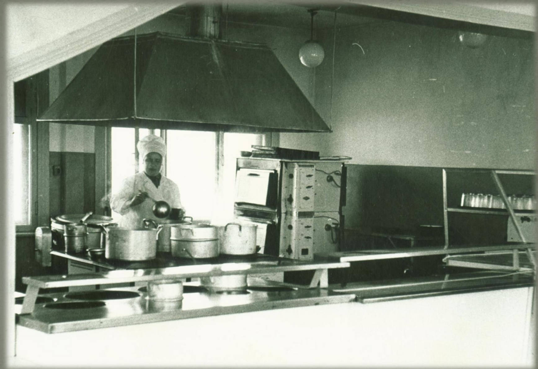
Кухня столовой «Елочка». Фонд Фото документов. Опись 2. Дело 6. Лист 10.