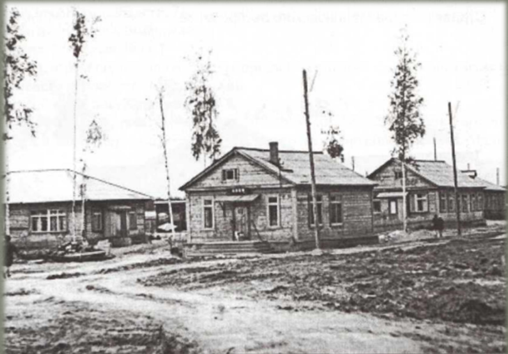
Таким был клуб в 70-е годы