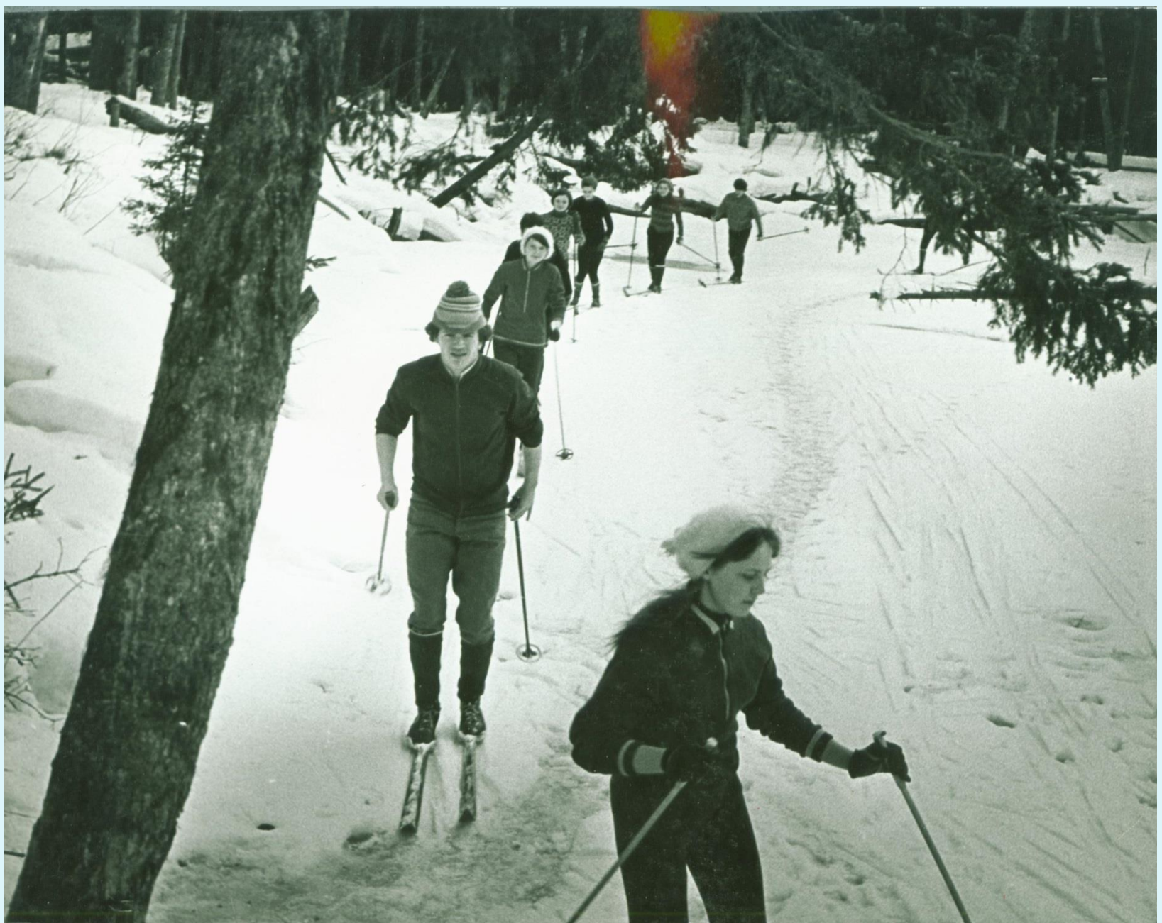
Фонд Фотодокументов. Опись 2. Дело 5. Лист 6об.