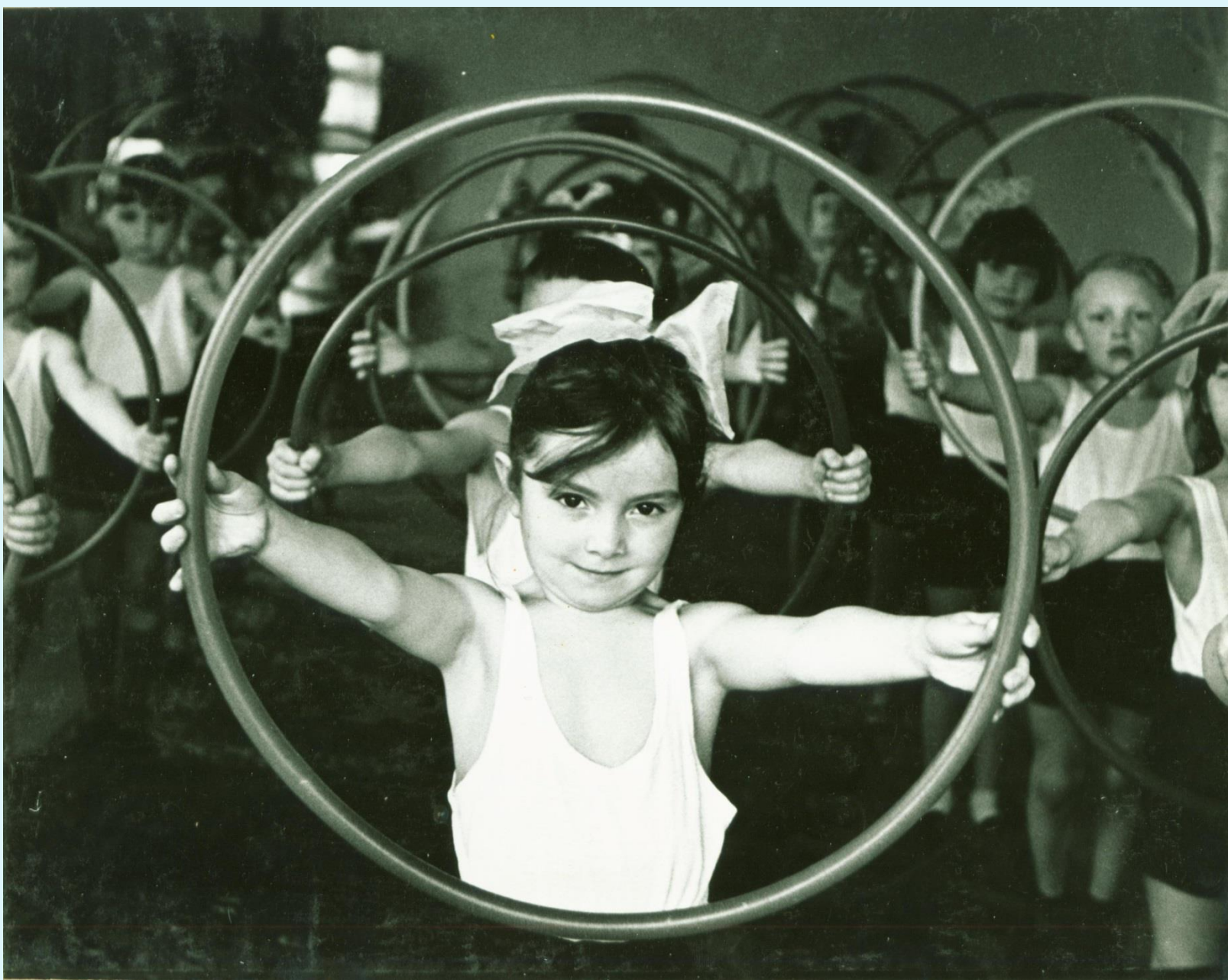
Воспитанники детского сада Пионерского леспромхоза на утренней гимнастике. п. Пионерский. 1970-е годы.

Фонд Фотодокументов. Опись 2. Дело 4. Лист 3об.