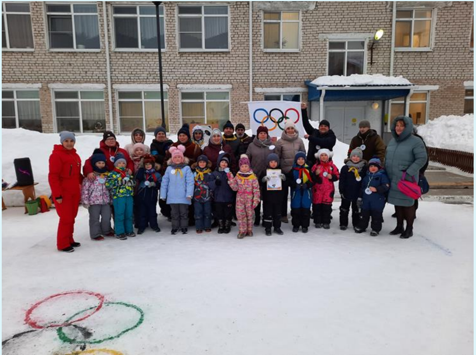
Малые зимние Олимпийские игры с детьми подготовительной к школе группы «Весёлые ребята» и родителями. 15 февраля 2022 года.