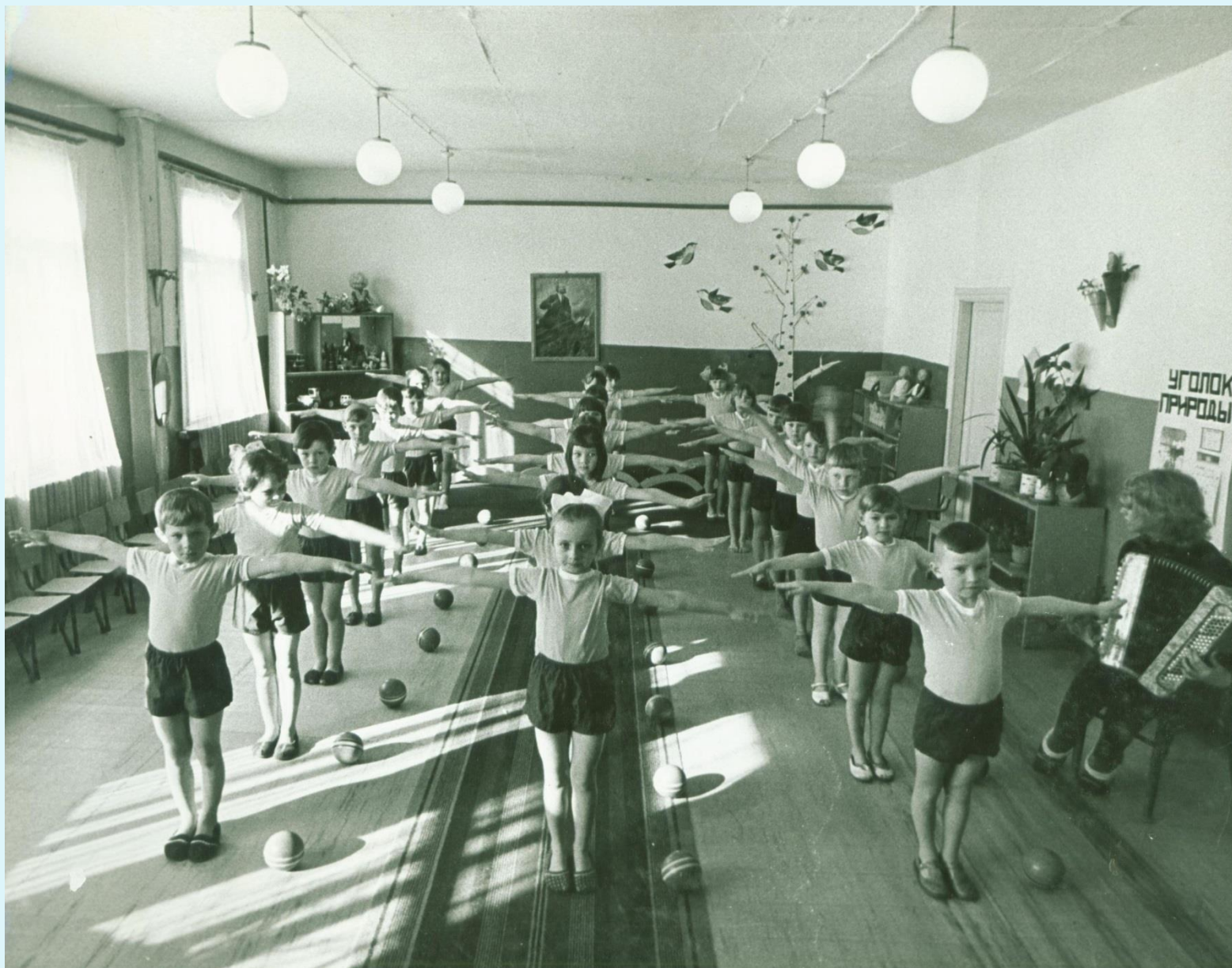
Воспитанники детского сада Алябьевского леспромхоза на утренней гимнастике. п. Алябьевский. 1970-е годы. Фонд Фотодокументов. Описание 2. Дело 5. Лист 3.