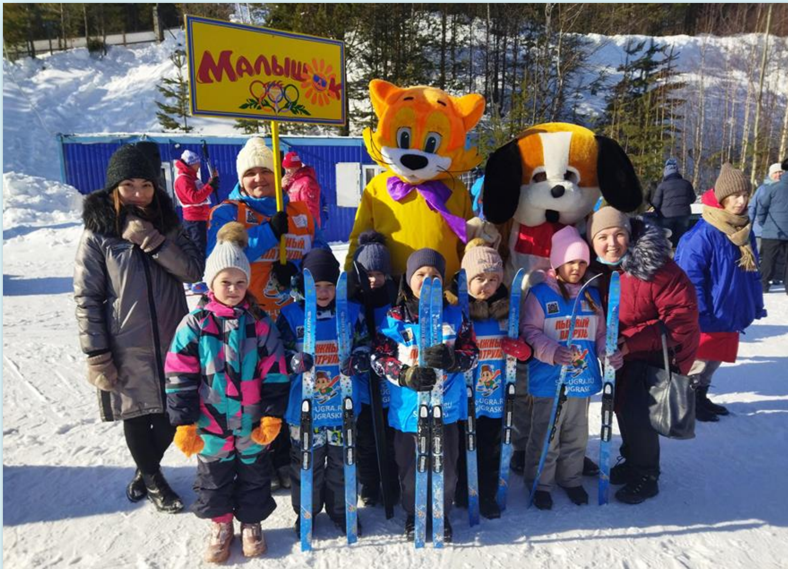
«Лыжня России – 2021» - реализация проекта «Лыжный патруль», участники, воспитанники подготовительных к школе групп: «Капелька», «Улыбка», «Радуга». (6-7 лет). Март 2022 года.