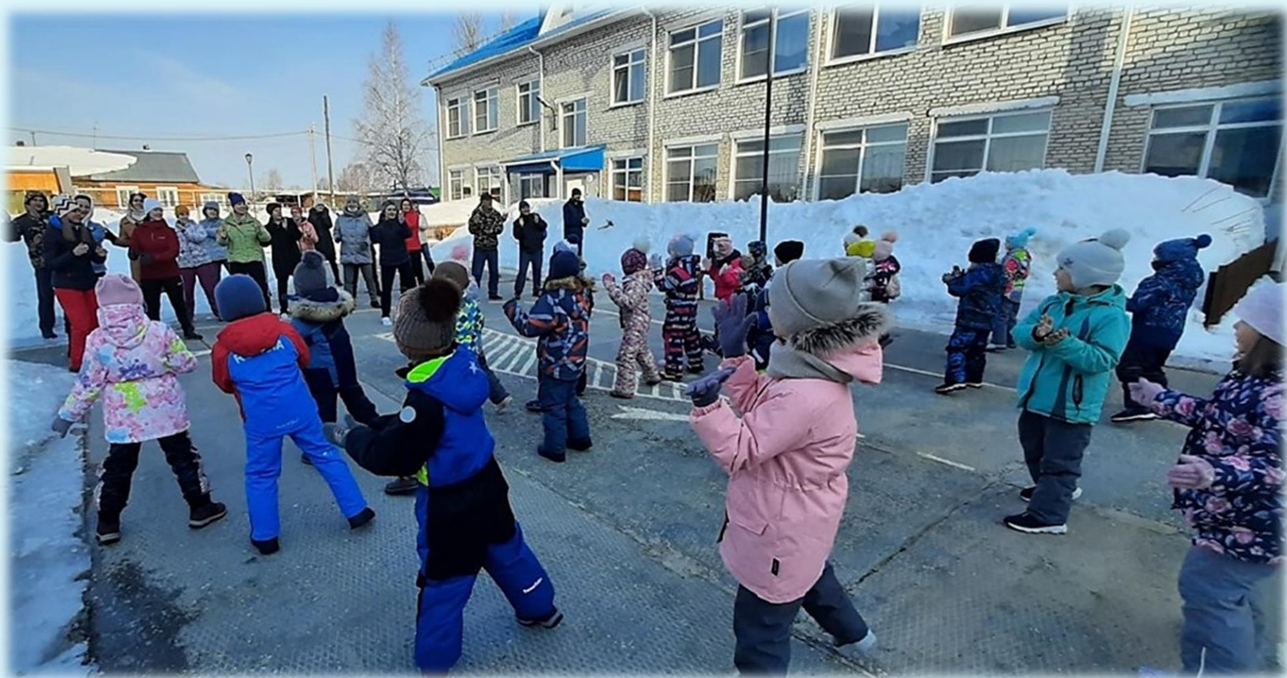
Утренняя гимнастика, посвященная Всемирному дню здоровья, с участием детей и родителей. 7 апреля 2022 года.