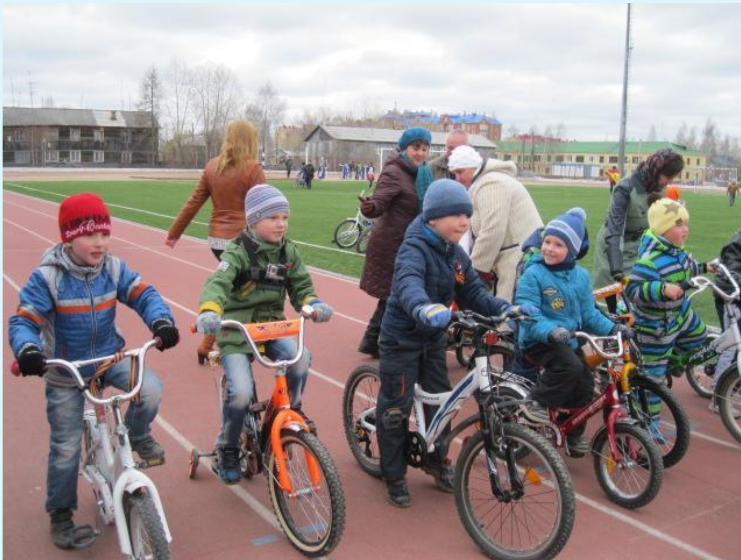
Районные состязания «Велостарт 2014». Участники - воспитанники старшего дошкольного возраста (5-7 лет) - май 2015 года.