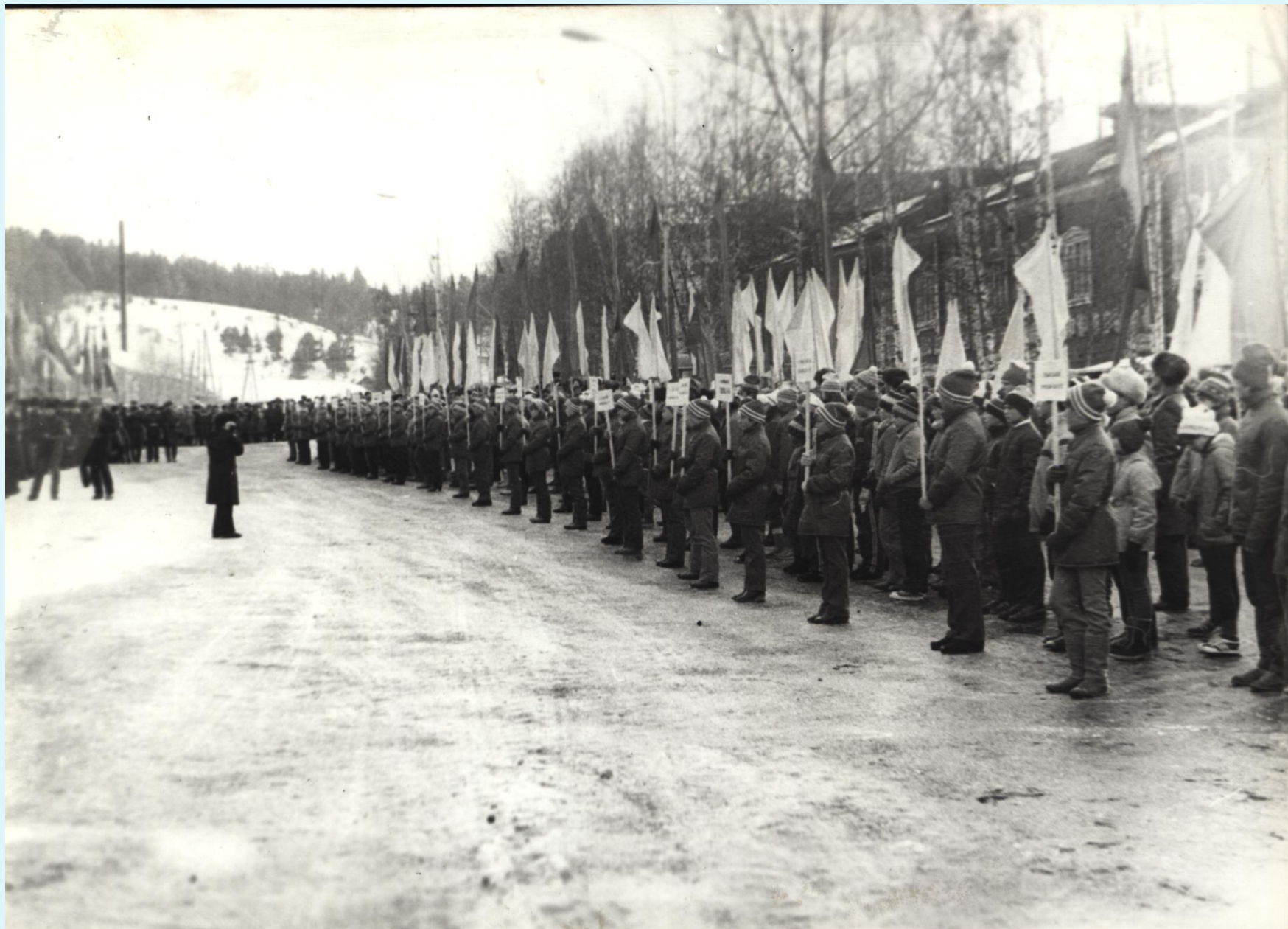
Парад участников финала XXXII Всесоюзных соревнований по лыжным гонкам на приз газеты «Пионерская правда». г. Ханты-Мансийск, центральная площадь. 28 марта 1984 года.

Фонд Фотодокументов. Описание 1. Дело 97.