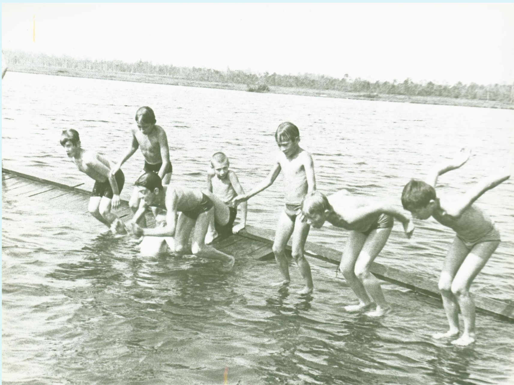
Учащиеся школ Советского района на отдыхе в спортивно-оздоровительном лагере «Мечта» на берегу озера Окунёво. Советский район.

Фонд Фотодокументов. Опись 2. Дело 32. Лист 15об.