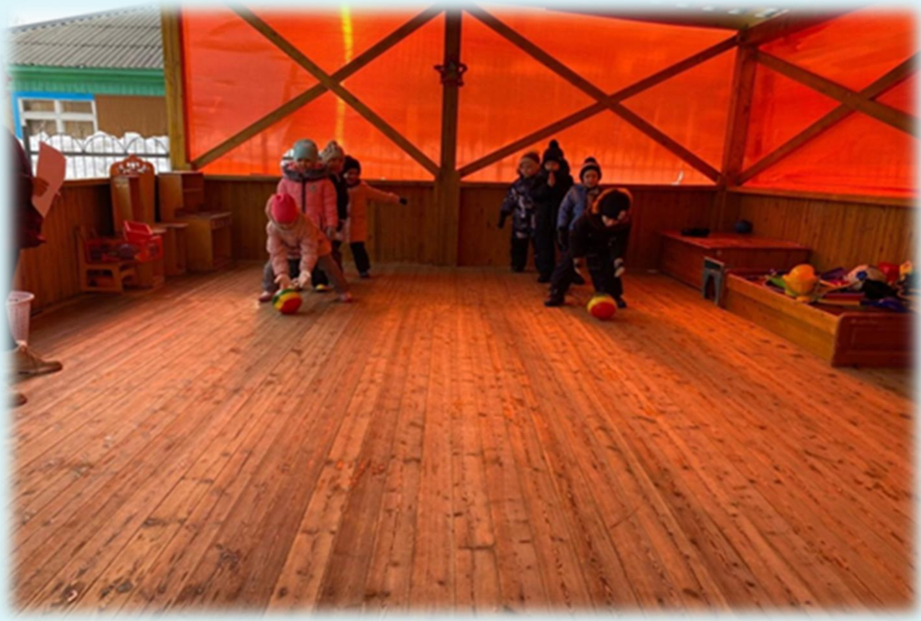
«День здоровья». 7 апреля 2022 года.