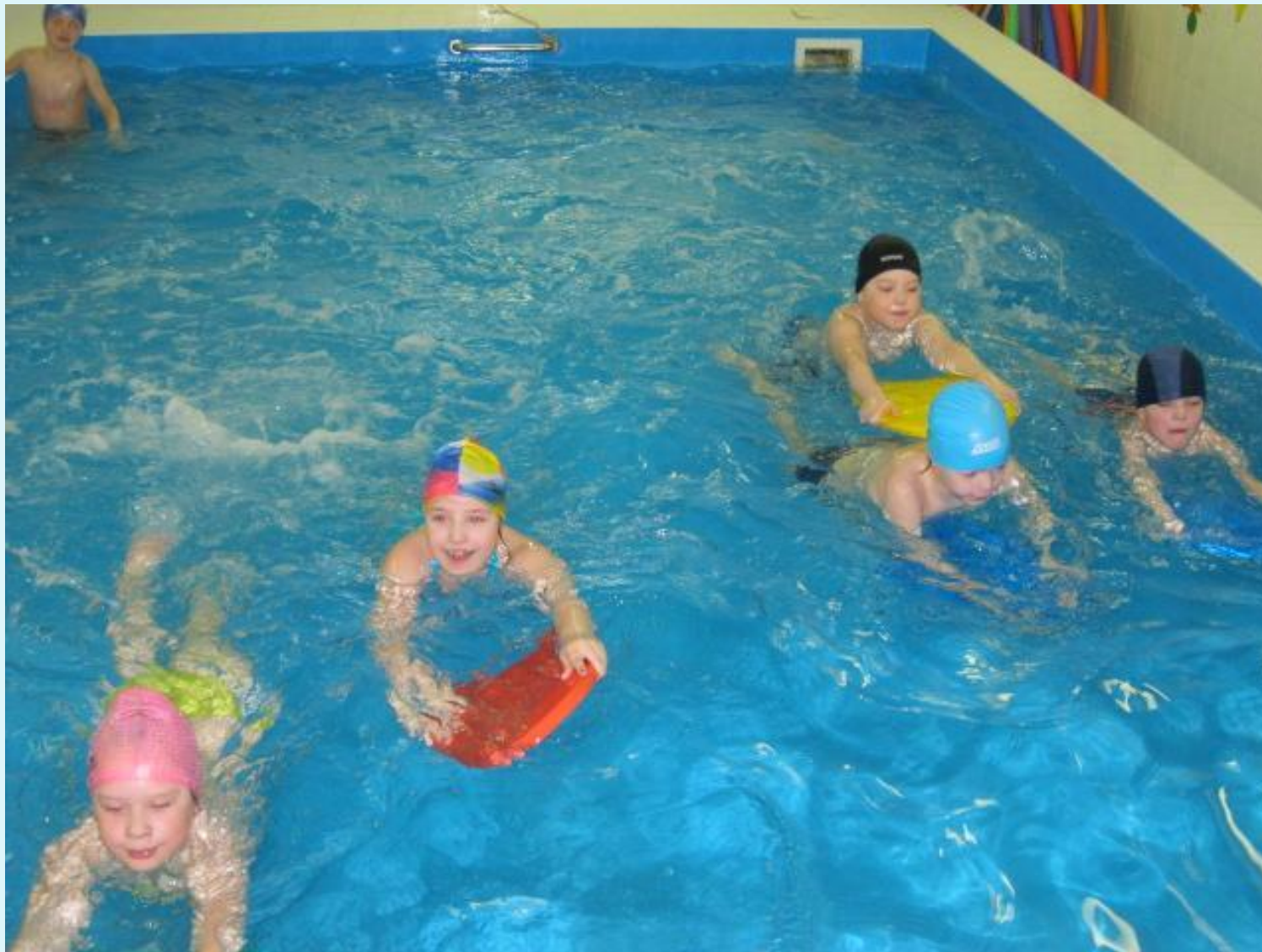
Спортивная секция «Плавание» на основе платного кружка на базе МАДОУ д/с «Радуга», участники - воспитанники старшего дошкольного возраста (5-7лет) МАДОУ д/с «Малышок». Март 2015 года.