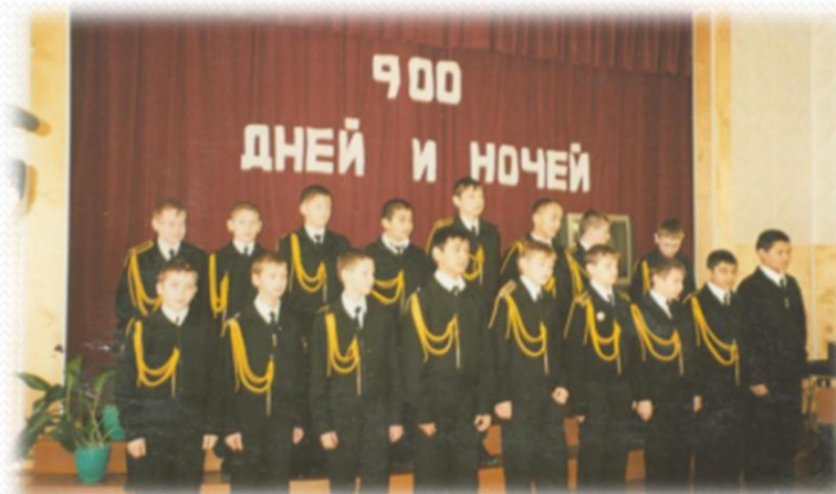
Концертная программа посвященная жителям Блокадного Ленинграда. 2008 год