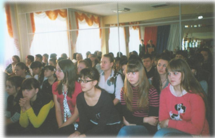
Благодарные слушатели. 2012 год