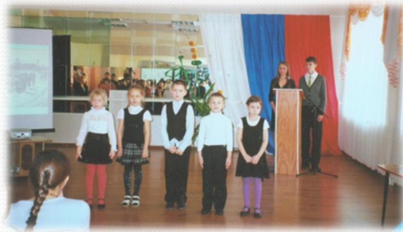
Дети продемонстрировали жителям блокадного Ленинграда свое мастерство в танцах, стихах, песнях. 2012 год