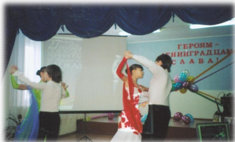
Праздничная программа посвященная Героям-Ленинградцам. 2009 год