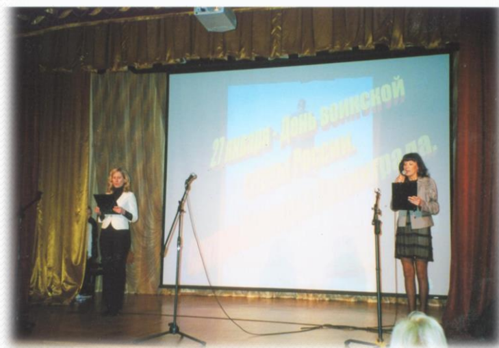
Творческий вечер в честь Дня воинской славы России. 2010 год