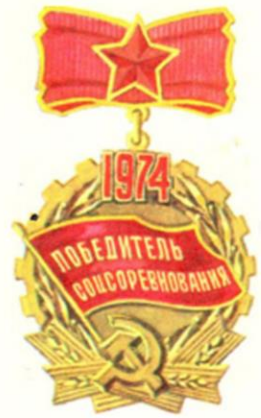
Знак учрежден Центральным Комитетом КПСС, Советом Министров СССР, ВЦСПС и ЦК ВЛКСМ