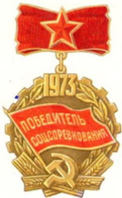
Знак учрежден ЦК КПСС, Советом Министров СССР, ВЦСПС и ЦК ВЛКСМ