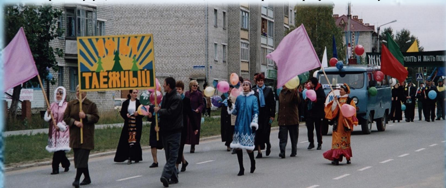
Участники праздничного парада представители трудовых коллективов учреждений, организаций посёлка Таёжный. 2003 год.

Жители верят в будущее своего маленького, но очень дорогого сердцу таёжного уголка.