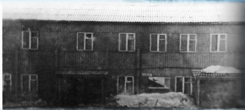
Старое здание почты

Объём работы был очень большой, ведь в первые годы телефонная связь не работала.