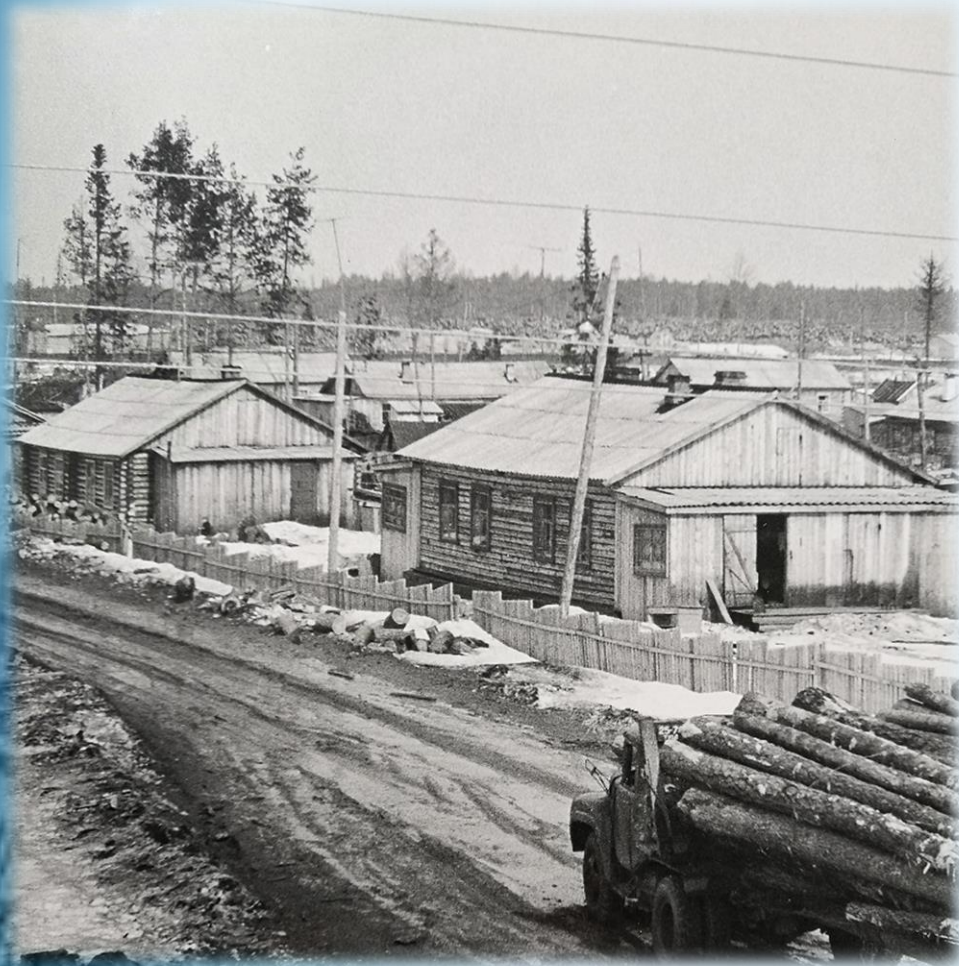
п. Таёжный. 1972-1973 год.

6 октября 1961 года прибыли первые строители. Рабочие семьи разместились в двух вагончиках. В 1962 году построили три щитовых дома, каждый из которых был разделен на 4 квартиры (четвертушки). В таких квартирах проживали до 8 человек. За продуктами в любую погоду ездили в Пионерский. Часть продовольствия, как и зарплату, привозили на вертолёте. Хлеб доставляли из мехколонны, которая находилась в нескольких километрах от посёлка.