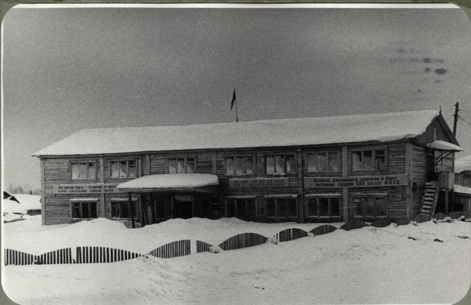
Административное здание Зеленоборского поселкового Совета народных депутатов 1979 г. Фонд фотодокументов. Опись 1. Дело 280.