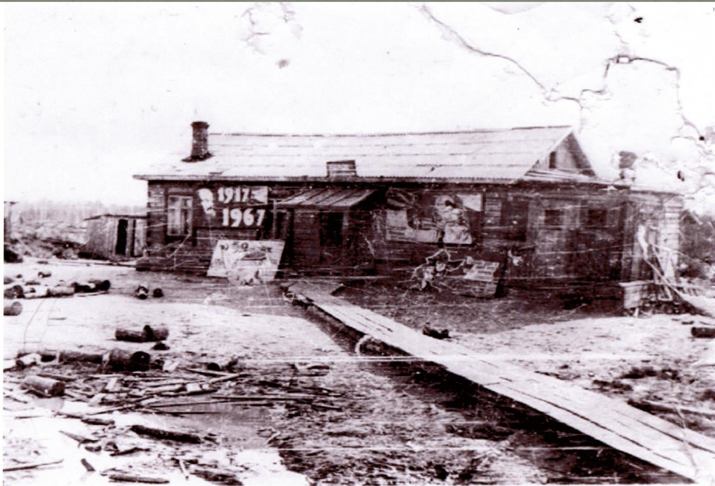
Первый Дом культуры п. Зеленоборск.

В 1966 году начато строительство клуба. По плану он должен вступить в строй в 1967 году.