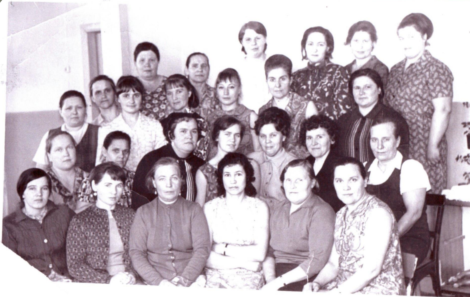
Коллектив детского сада «Берёзка» 1971 год.