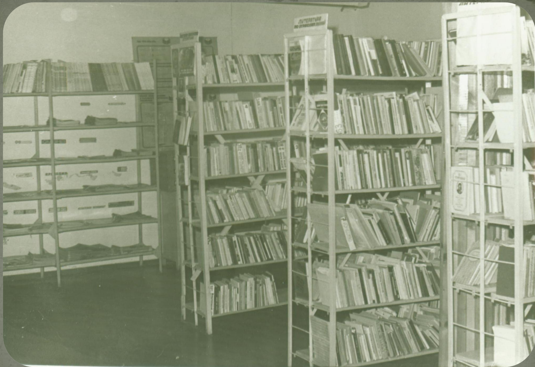
Помещение библиотеки п. Зеленоборск. Фонд фотодокументов. Опись 2. Дело 11. Лист 22 «а».