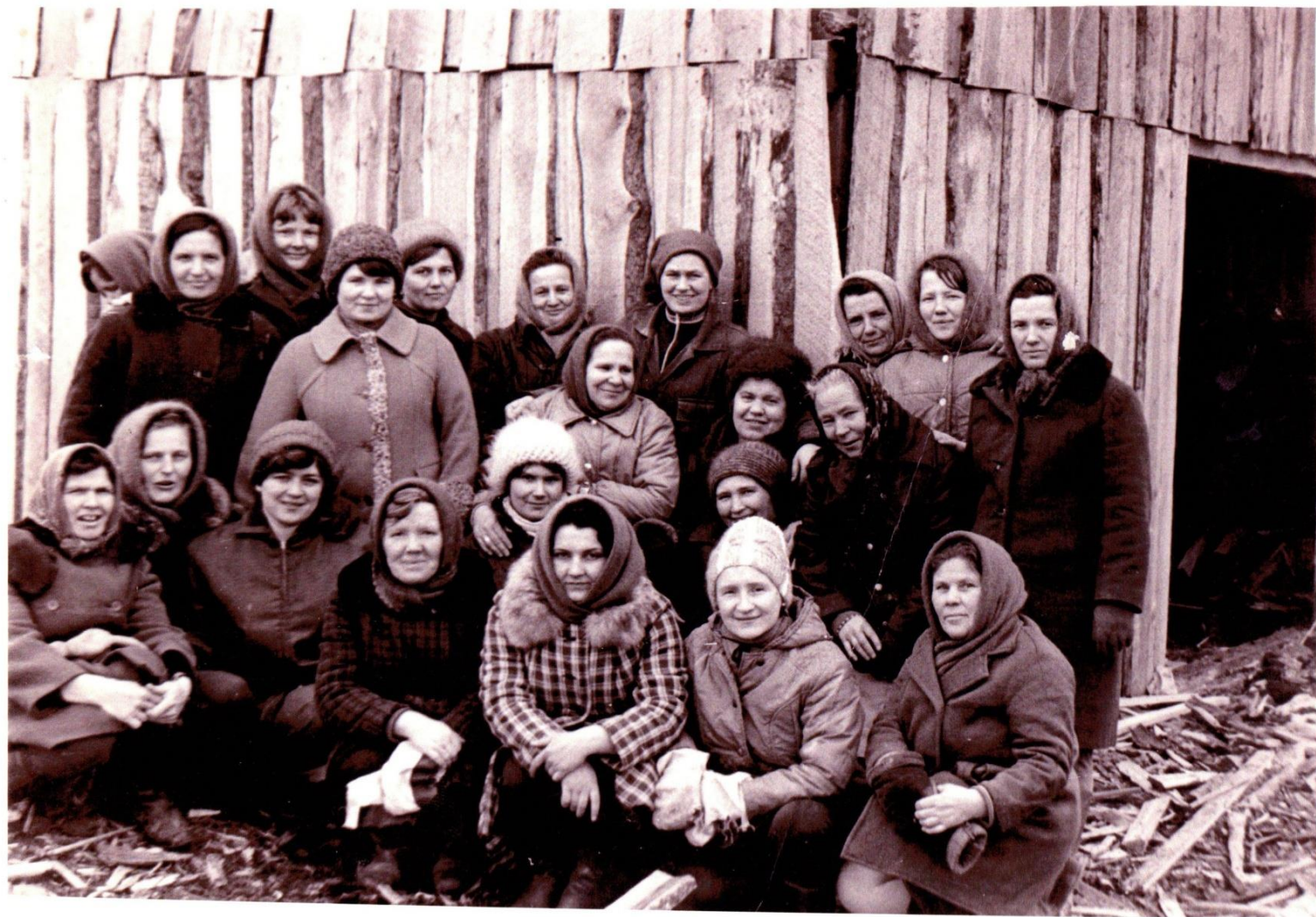
Коллектив детского сада «Берёзка» (на субботнике по заготовке дров).