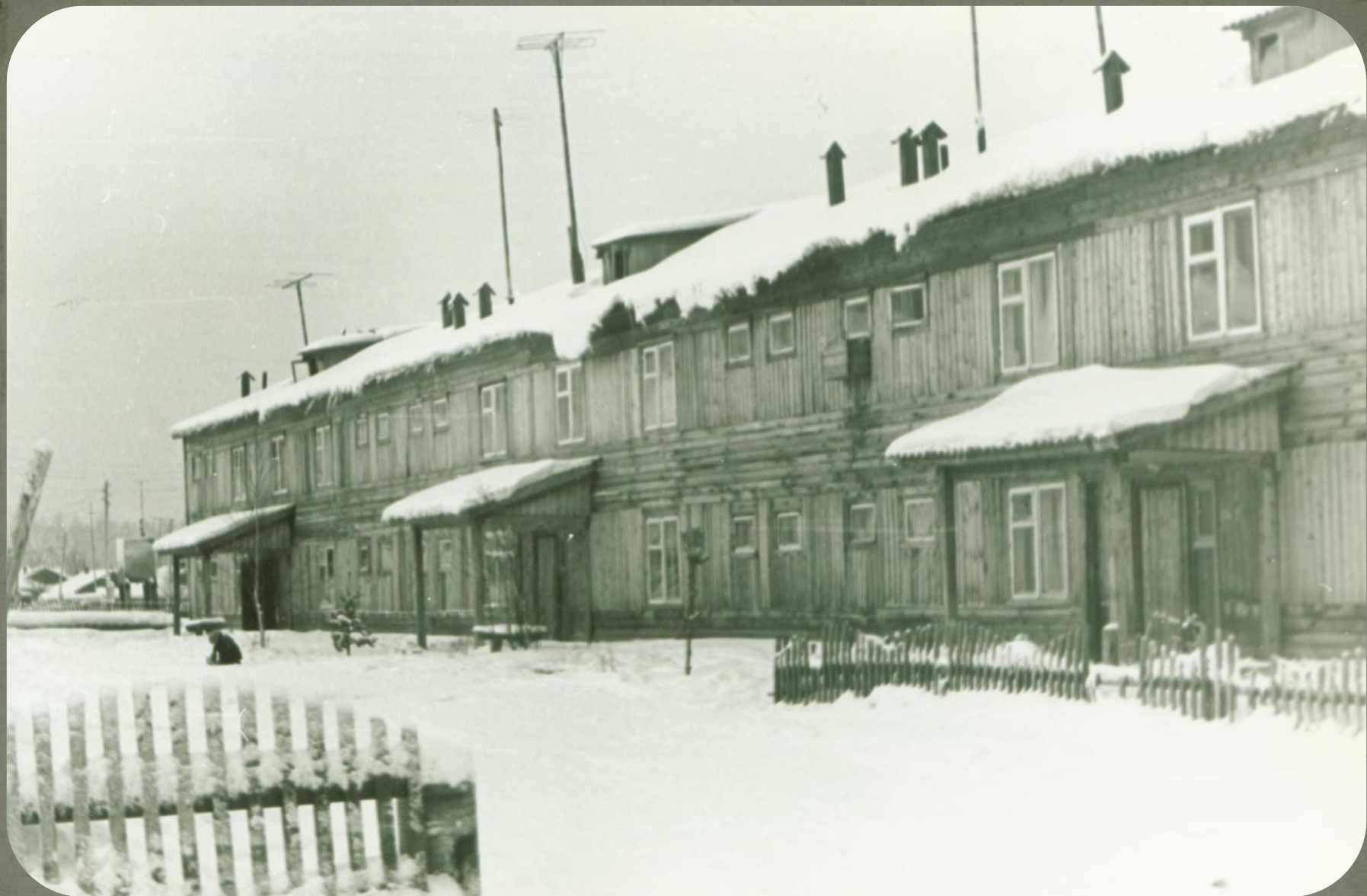
12-ти квартирный жилой дом для учителей школы п. Зеленоборск. Фонд фотодокументов. Опись 2. Дело 11. Лист 5.