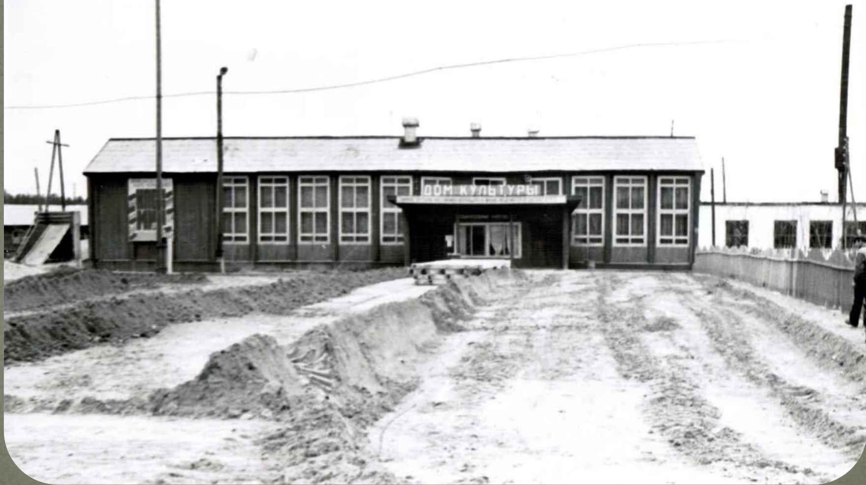
Дом культуры п. Зеленоборск 1985г.