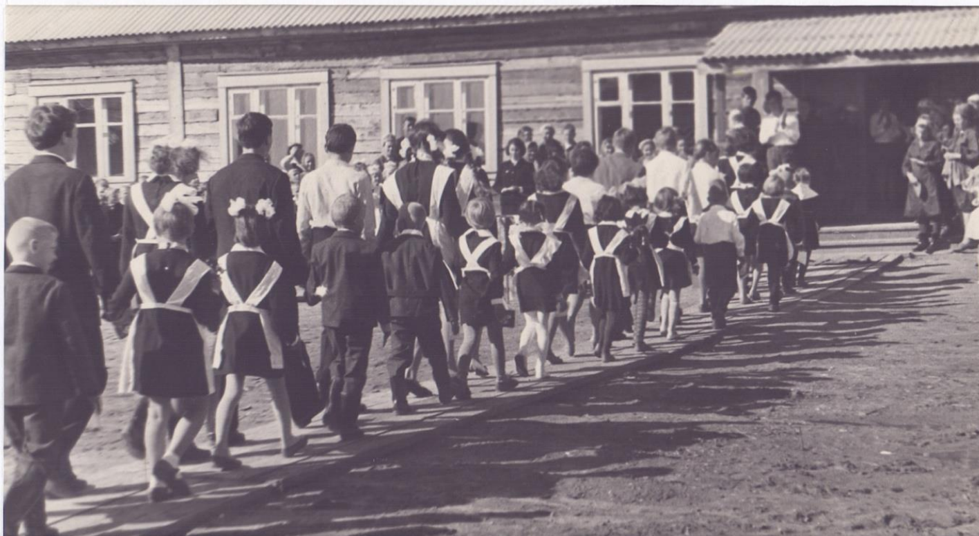
1967г. Открытие Зеленоборской средней школы

Открытие Средней общеобразовательной Зеленоборской школы. 1 сентября 1967 год.