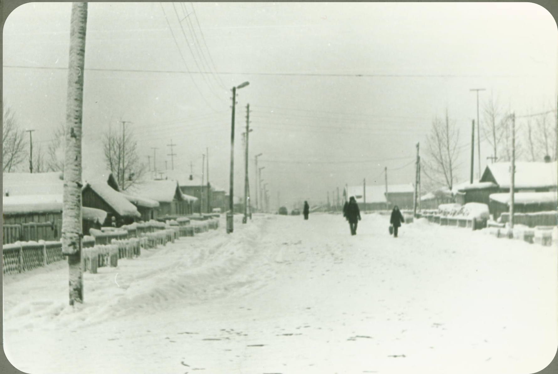
Одна из освященных улиц п. Зеленоборск. Фонд фотодокументов. Опись 2. Дело 11. Лист 20 «а».