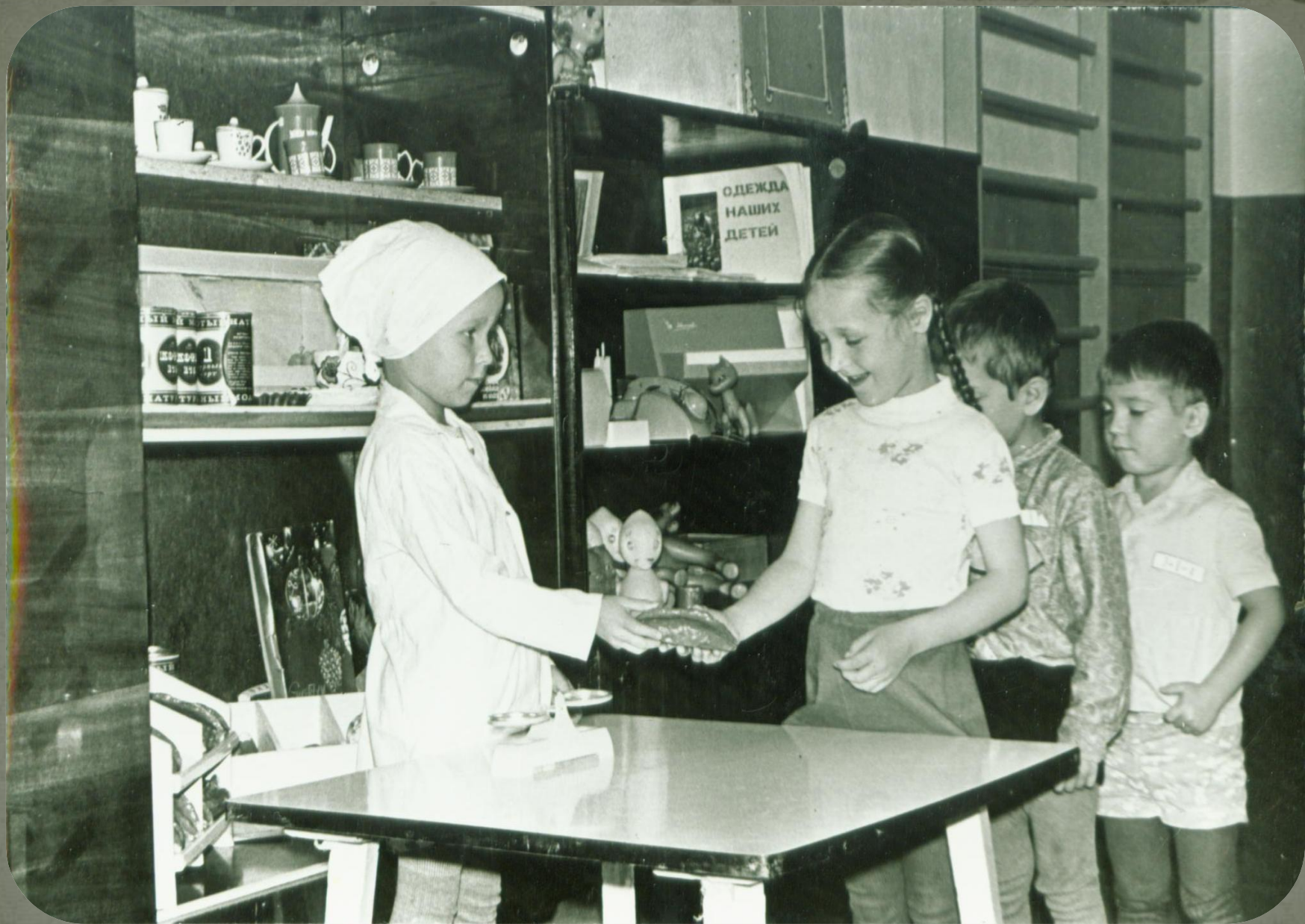
Воспитанники детского сада «Березка» п. Зеленлборск. 1997 год. Фонд фотодокументов. Опись 2. Дело 11. Лист 13.