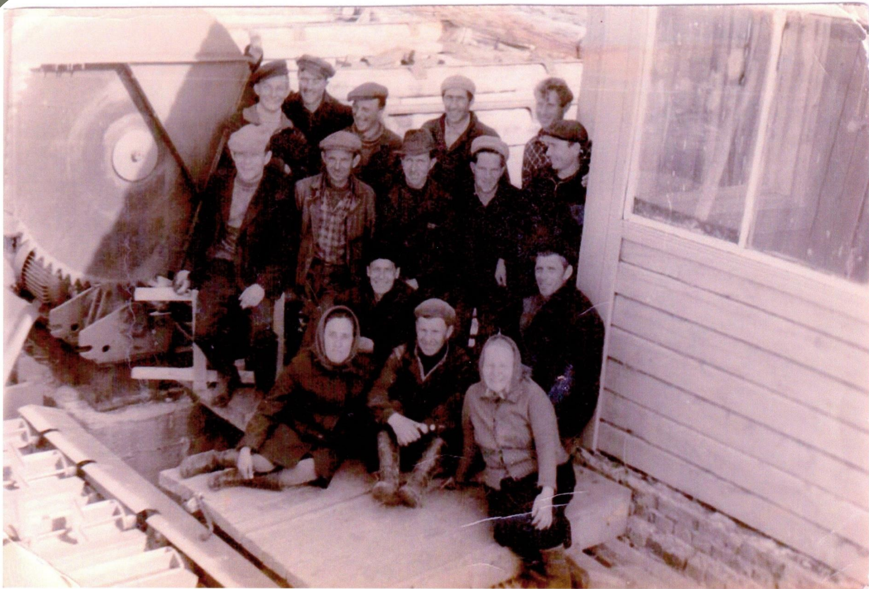
Зеленоборский ЛПХ. Рабочие пилорамы.