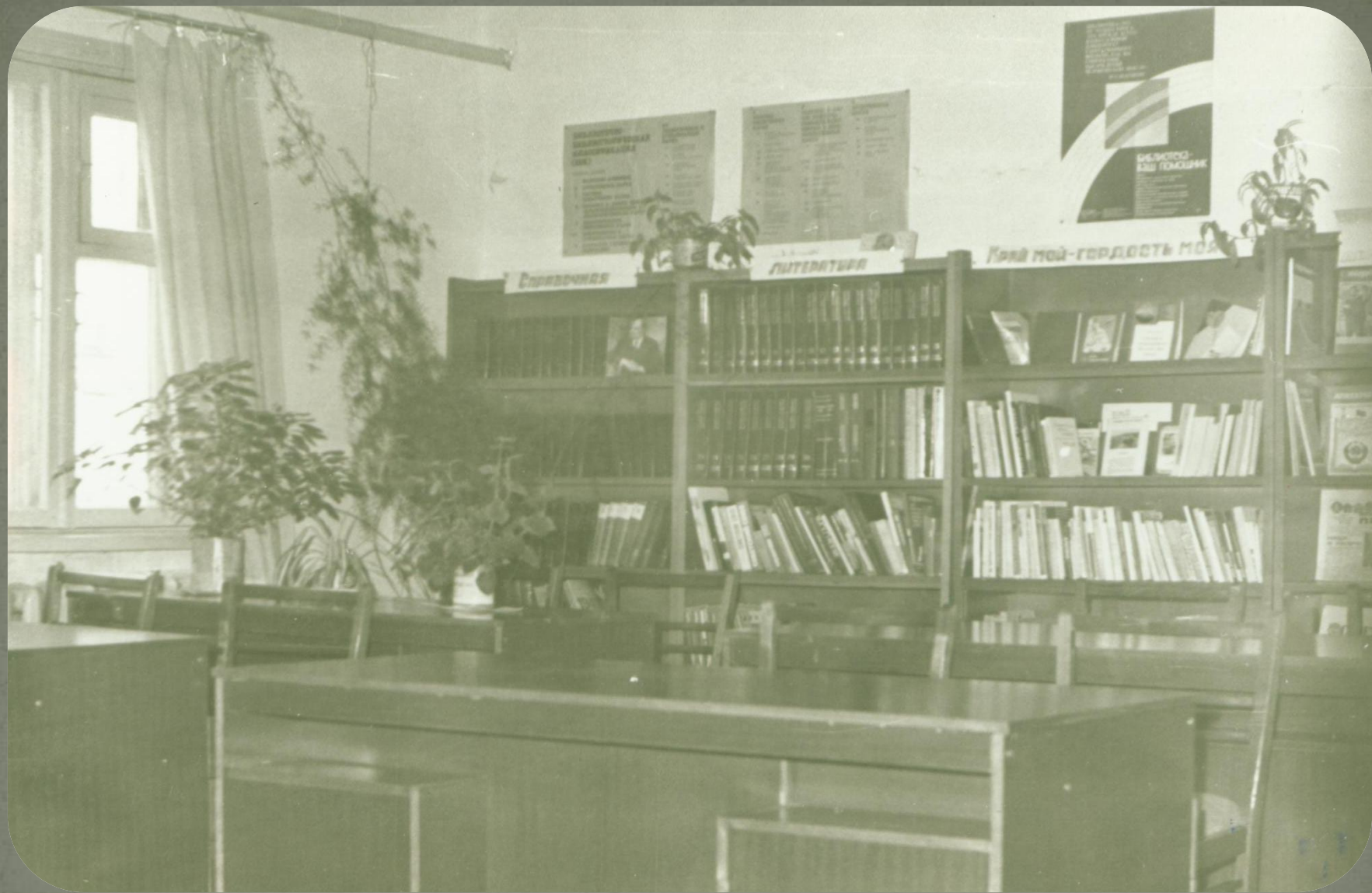
Помещение библиотеки п. Зеленоборск. Фонд фотодокументов. Опись 2. Дело 11. Лист 22.