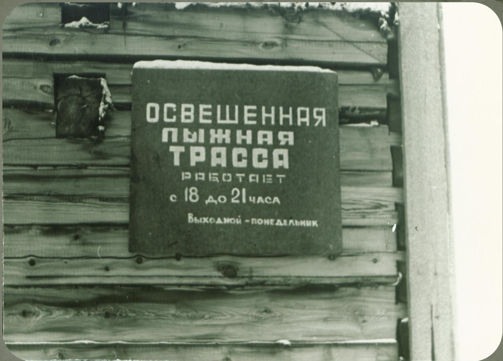
Фонд фотодокументов. Опись 2. Дело 11. Лист 3.