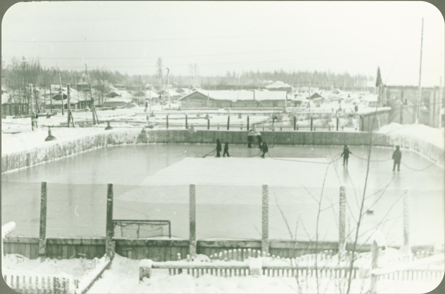
Открытый корт для игры в хоккей п. Зеленоборск. Фонд фотодокументов. Опись 2. Дело 11. Лист 7.