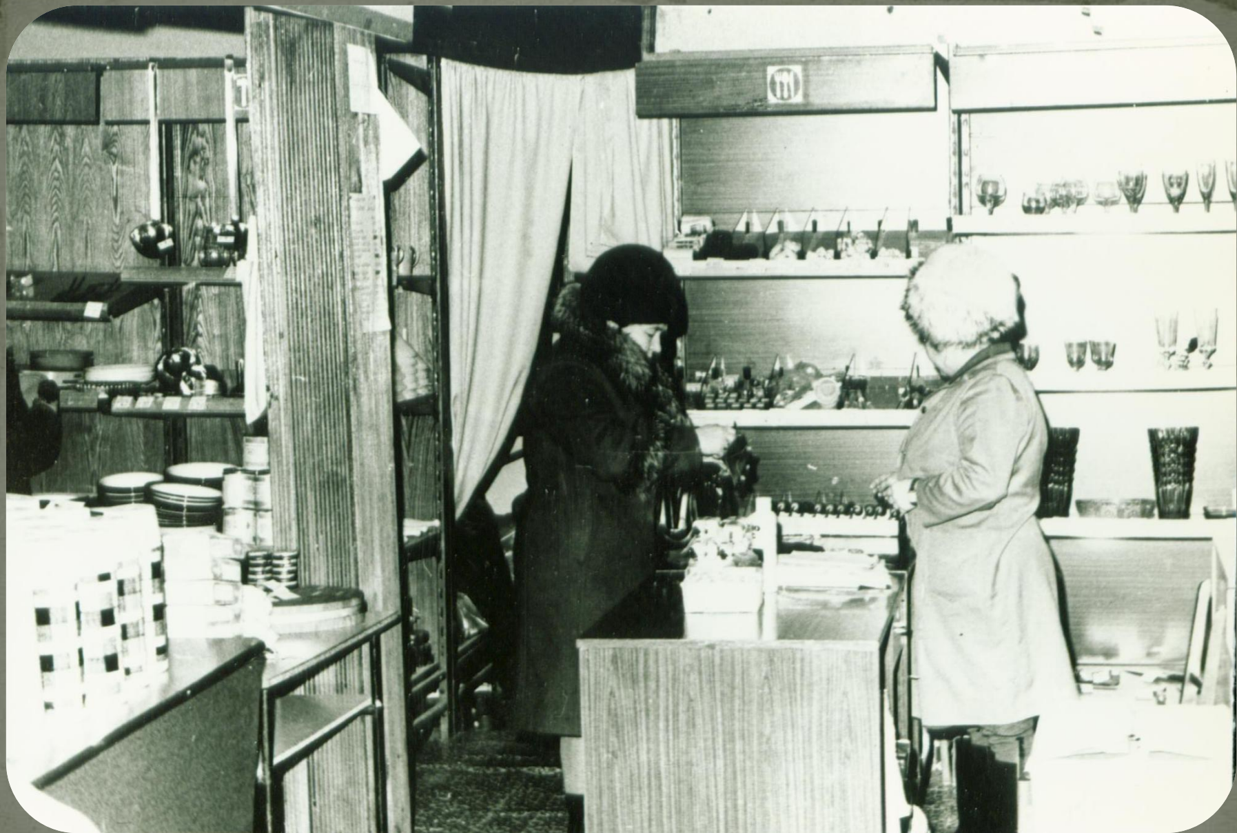
Магазин хозяйственных товаров п. Зеленоборск. Фонд фотодокументов. Опись 2. Дело 11. Лист 20.