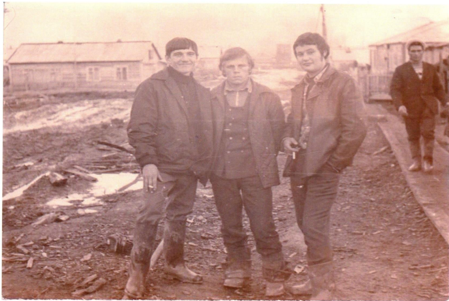
На одной из первых улиц Зеленоборска, 1970-е годы.

Сегодня дорога строится и молодые парни их 30 человек, которые ведут отсыпку полотна, тоже видят тот не далекий день, когда по дороге, проведенной через болота и тайгу их руками, пойдут машины. Сегодня они делают все чтобы приблизить момент пуска.