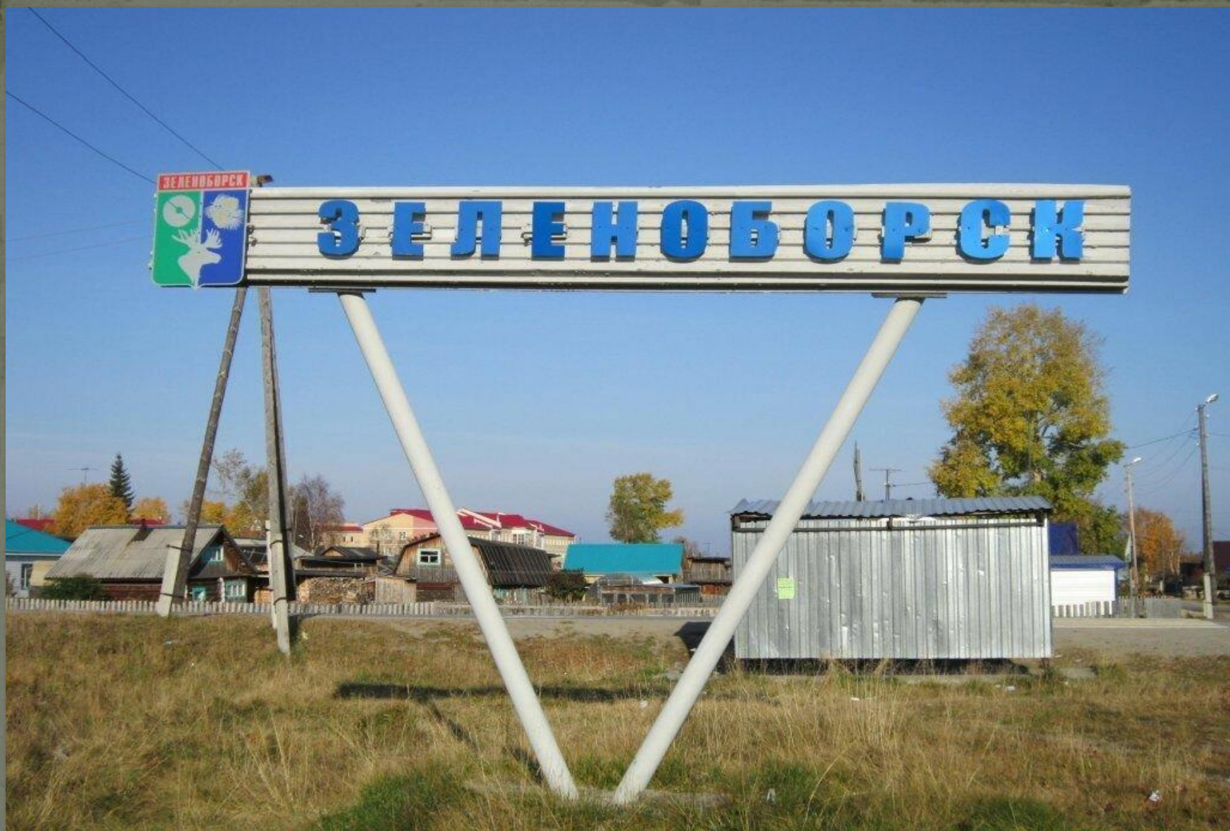
Городское поселение Зеленоборск. Выставка посвященная 55-летию образования Советского района .