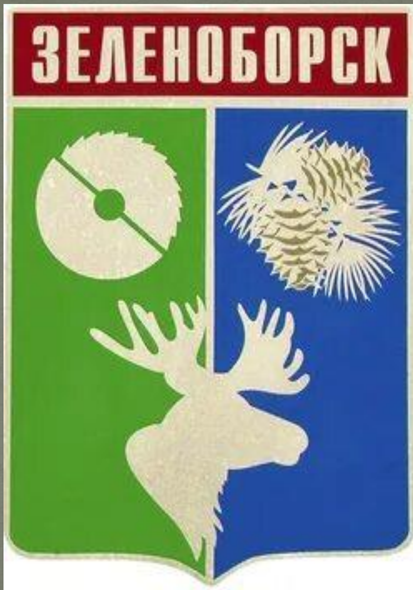
Герб п. Зеленоборск.

С годами п. Зеленоборск только хорошеет, полнится новыми событиями, датами, делами!